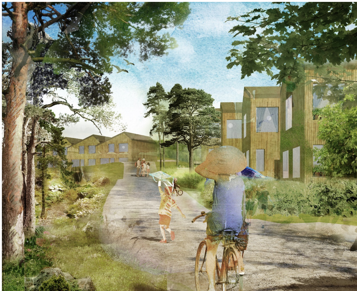
Visionsbild över området Amperen. Illustration: Amanda Wahlén, Sweco architects

Radhusen ska utformas med hänsyn till befintlig topografi. Lågskalig, terränganpassad karaktär är viktiga aspekter. Radhusbebyggelsen ska samspela väl med angränsande bebyggelse och natur.