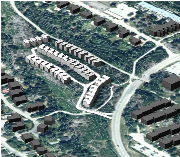
DP Amperen, perspektivbild från den framtagna volymstudien.

Kulörer och materialitet ska ges ett eget uttryck som skiljer sig från den befintliga bebyggelsen, och hänsyn ska tas till områdets läge intill Skarpnäs naturreservat. Byggnader ska placeras varsamt i terrängen och hänsyn bör även tas till landskapsbilden i form av bergsbranter och berg i dagen samt skogshöjder. Det är önskvärt att nyttja redan behandlade ytor så att sprängning undviks. Föreslagna radhus bör utformas med material som åldras med värdighet och patina. Äkthet i material bör eftersträvas. Kommunen ser positivt på och uppmuntrar bebyggelse i trä. Ytorna mellan radhusen ska skapa möjligheter till samvaro och lek för barn såväl som för vuxna.