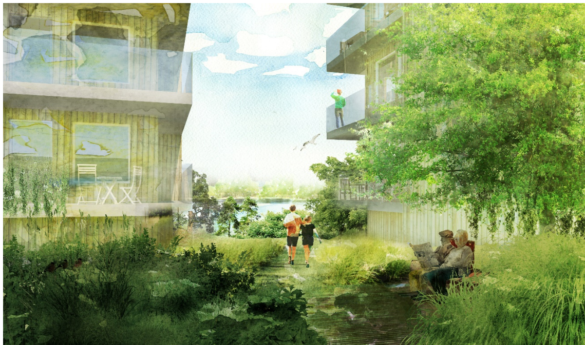
Visionsbild över området Pylonen. Illustration: Amanda Wahlén, Sweco architects