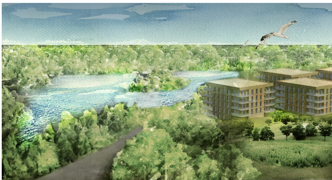
Visionsbild. Illustration: Amanda Wahlén, Sweco architects

Område 2: Cirka 6 800 kvm ljus BTA bostäder (radhus)