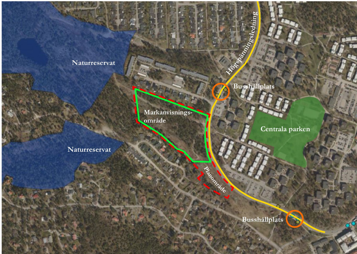
Flygfoto över västra delen av Ormingeringen. Planområdet Amperen utmärkt med röd linje, varav markanvisningsområdet är markerat med grön linje. Observera att bebyggelsefritt avstånd ska hållas till högspänningsledning och hänsyn behöver tas till kommande naturreservat.