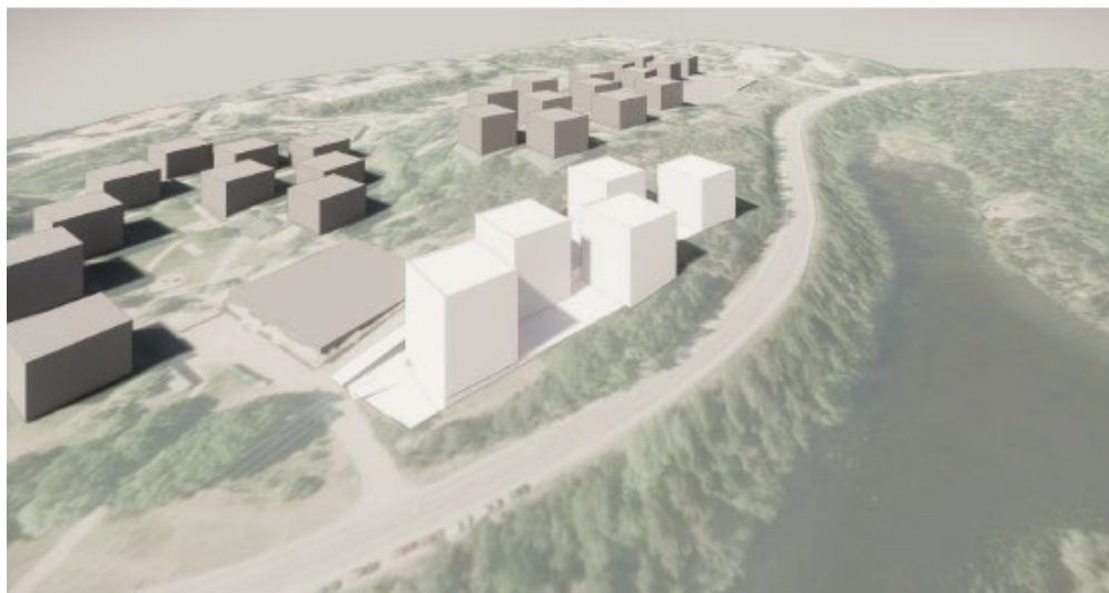
Området Pylonen, perspektivbild från den framtagna volymstudien.

Den föreslagna bebyggelsens fotavtryck ska efterlikna den befintliga bebyggelsen söder om området och sträva efter känslan av "hus i park". Utrymmen för lek uppmuntras på kvartersmark.