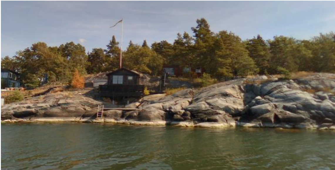
Vy från vattnet 2018