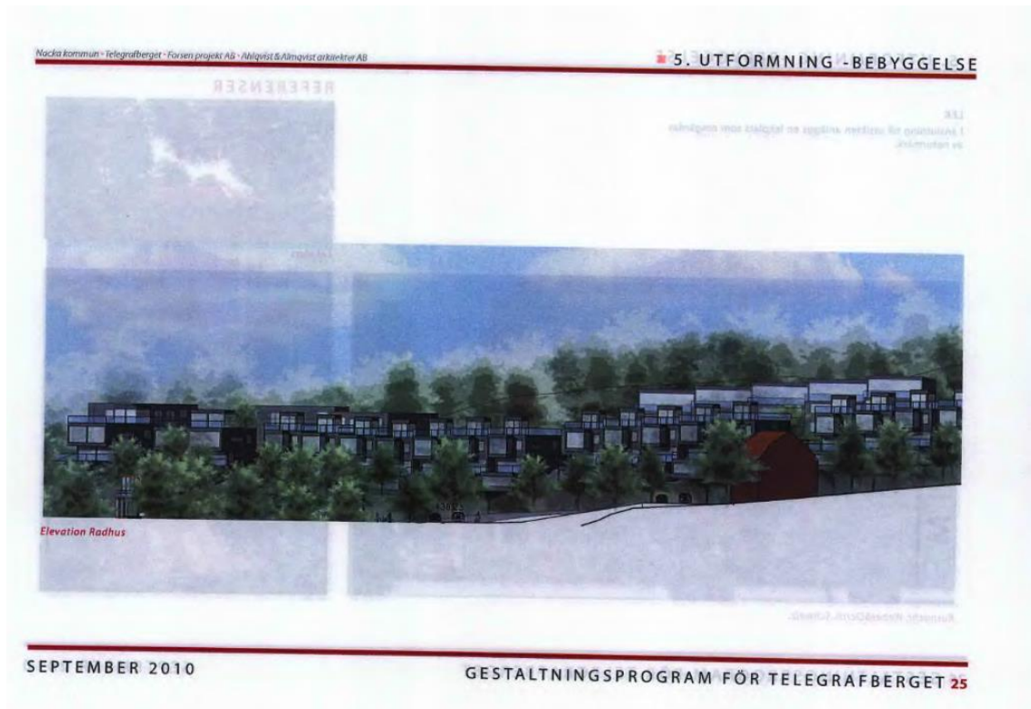
Illustration av radhusen från gestaltningsprogrammet.