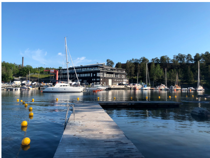
Figur 3. Saltsjö pir sedd från Fiskarholmens barnvänliga badplats.

matiserat som ett ”ghetto” där fattiga, sjuka och invandrare hamnade. Alla invandringsvågor sedan 1970-talet har kommit att representeras här: en första våg av finländare, greker, ryssar och polacker, en andra av iranier, chilensare och jugoslaver, en tredje av eritreaner och en fjärde av somalier, irakier och syrier. Den etniskt svenska arbetarklassen bor knappt kvar längre i höghusområdet, men den ständiga kontakten med nya invandrare verkar göra att ”Fiskis” till sin platskaraktär är fundamentalt etniskt heterogen och med en kollektivt delad erfarenhet av att vara en icke-svensk i det dominerande samhällets ögon. Stigmatiseringen blev också till viss del ”inbyggd” av den fysiska miljöns utformning – efter stora protester från nästliggande Saltsjöbadensområdet Igelboda blev den planerade motorvägen som skulle binda samman Fisksätra och Saltsjöbaden istället lagd som en halv-måne runt orten, vilket har bidragit till att