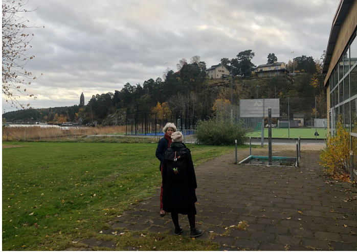
Figur 7. Näckenbadets kortsida till höger, Neglingeviden till vänster. 2021.