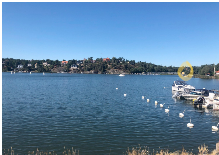
Figur 5. Gamla Näckenbadet sedd från Neglingeön 2021.