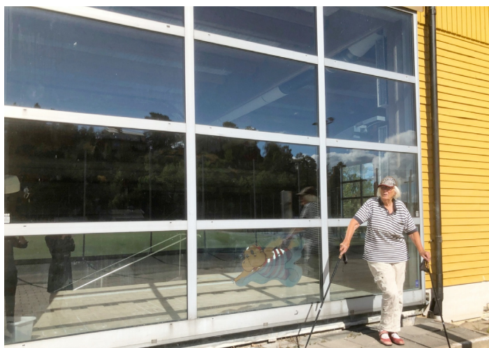
Figur 6. En engagerad Fisksätrabo utanför det stängda Näckenbadet 2020.

nen hade sålt ut en fjärdedel av sitt sociala fastighetsbestånd för att kunna bygga mer fritidsbebyggelse (Fastighetsvärlden, 2014). Placeringen tycktes självklar för kommunfullmäktige: eftersom detaljplanen fortfarande gällde för om-