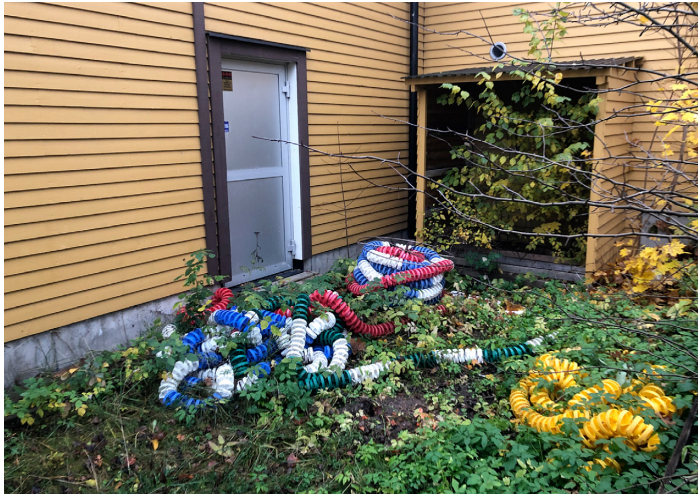
Figur 8. Neglingebadet 2021.

söksunderlagen vida överträffa om placering i Fisksätra, men att det skulle gå snabbare och bli billigare med Saltsjöbaden-placeringen. Medan Fisksätra skulle kosta 120 miljoner kronor, skulle Näckenbadet bara kosta 95 miljoner och dessutom