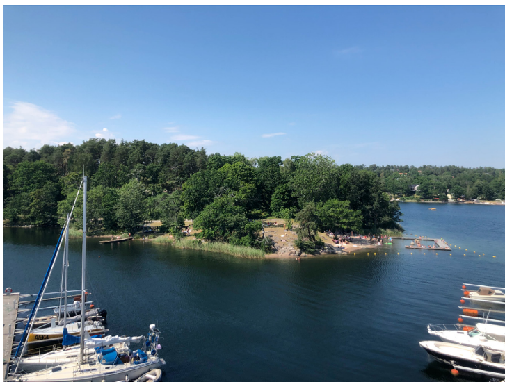
Figur 2. Fiskarholmen och dess barnvänliga badplats sedd från Saltsjö pir.

husen, utan också den närmaste kommunala (om än privatdrivna) simhallen för båda orterna. Det är också i detta avseende intressant att kort jämföra de historiska parallellerna mellan orternas uppkomster, rörande deras koppling till vattenrelaterade rekreativmöjligheter in på det urbana husknutar. Båda platserna köptes loss från fideikommisset Erstavik (vars adelsläkt fortfarande äger omkringliggande skog runt Fisksätra): Saltsjöbaden erhöles av K.A. Wallenberg 1889, Fisksätra av kommunen 1946 (af Kleen, 2010); Wallenberg ämnade skapa en badort med tillhörande villastad, Fisksätra marknadsfördes som ”Skärgårdsstaden” där den moderna 70-talsfamiljen skulle ha nära till såväl stad som skog och havet. Båda platserna uppfördes alltså för att ge människor lättillgängliga rekreerande njutningar som ansågs höra till den ”icke-urbana” sfären, där vattnet var centralt för båda två.