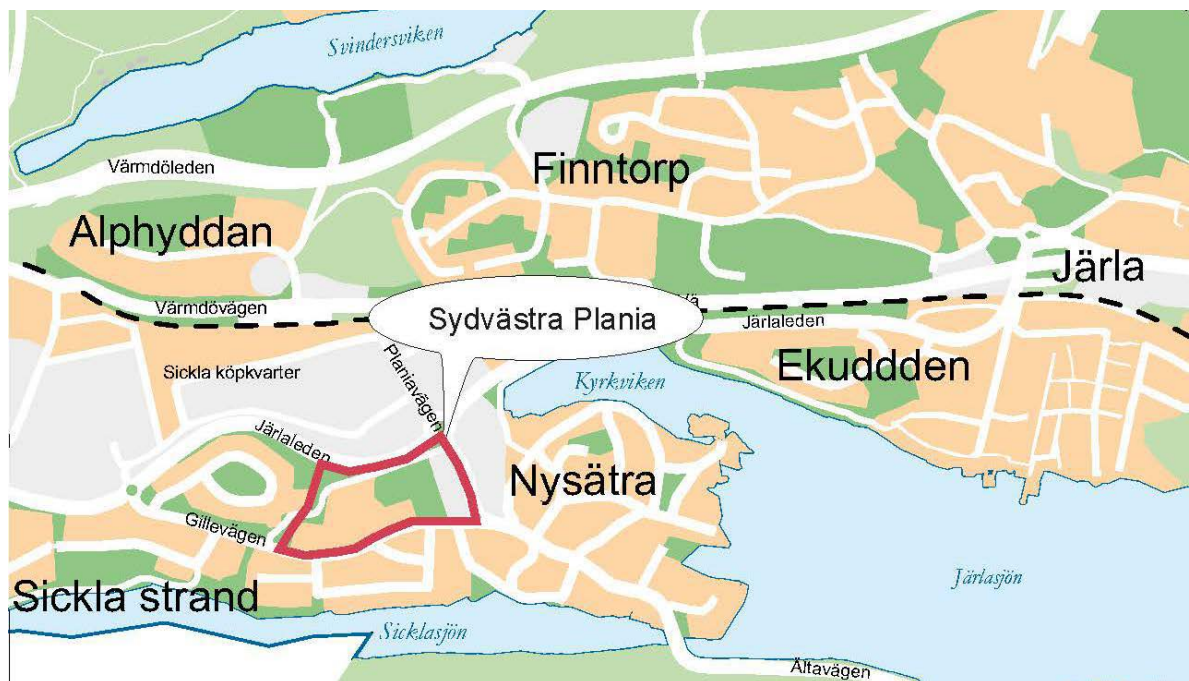
Kartan visar områdets avgränsning.