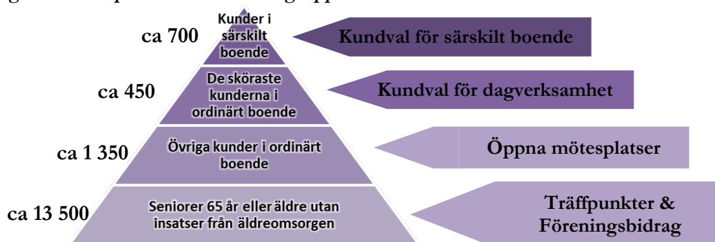
Figur 1. Mötesplatser för olika målgrupper

Figur 1. nedan beskriver vårt förslag på hur Nacka kommun på en övergripande nivå kan möjliggöra för olika målgrupper att ta del av hälsofrämjande aktiviteter.