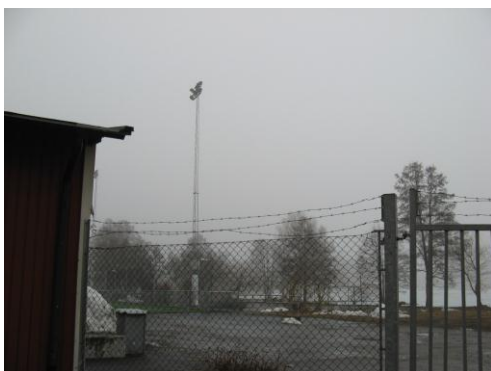
Försök inte klättra över