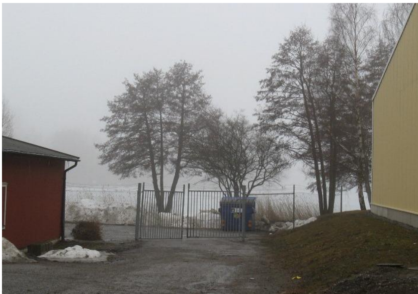
I byggnaden till vänster har Ältens fiskeklubb sitt förråd Byggnaden till höger är Älta Tennishall

Med staket, grindar, kedjor, lås och taggtråd utestängs allmänheten effektivt från tillträde till kommunens fina strandparti.