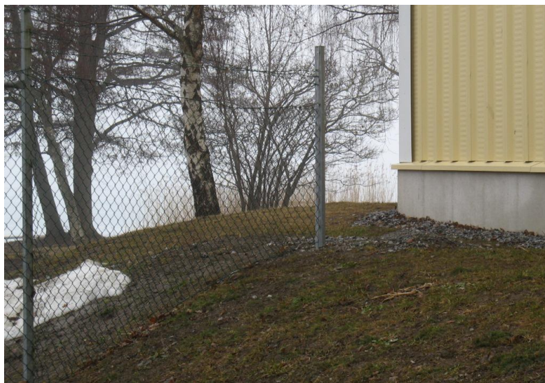
Klättrar man uppför slänten går det dock att ta sig igenom