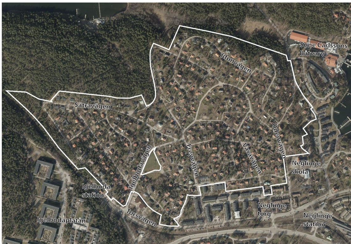
Kartan visar ett flygfoto över Igelboda med omnejd.

Området Igelboda ligger i kommundelen Saltsjöbaden i Nacka kommuns sydöstra del. Planområdet gränsar i norr och väster till Skogsö naturreservat. I söder utgör Torsvägen och Saltsjöbanans spår en gräns, men flerfamiljsbostäderna norr om Torsvägen innefattas inte i planområdet. Planen omfattar cirka 0,5 kvadratkilometer (drygt 50 hektar) landareal. Större grönytor och vägar inom planområdet ägs av kommunen. Resterande fastigheter inom planområdet ägs av respektive husägare.