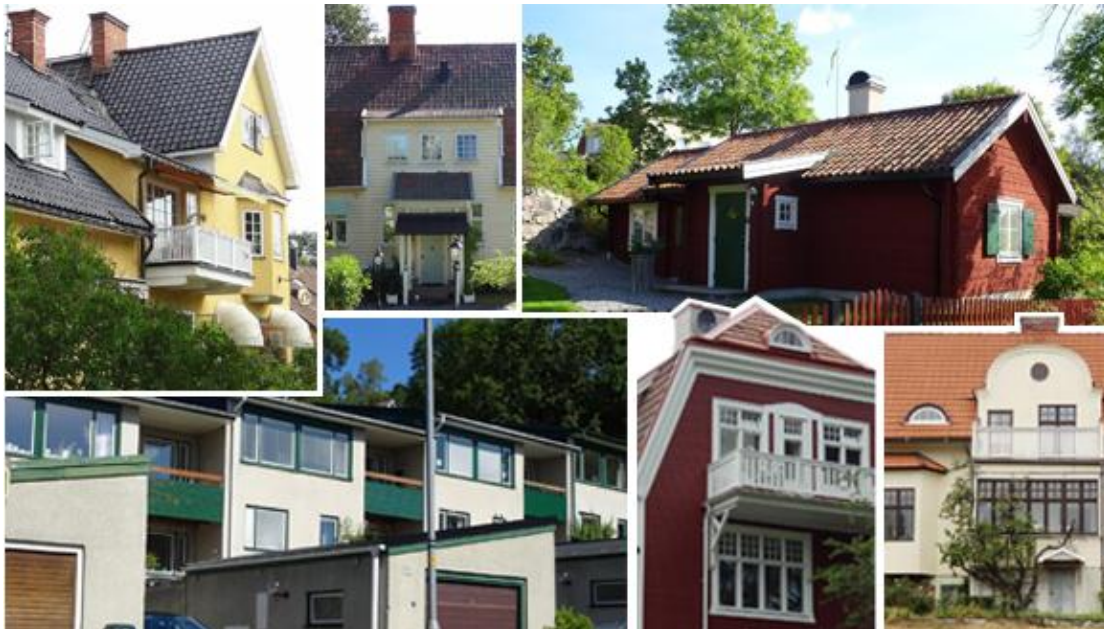
Foton av KMV Forum