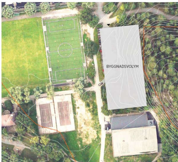
Bild beskriver volymen på placering 2 utifrån multianläggning med viss friidrottsinriktning och sprintbana 60 meter.

Bild beskriver placering 1 för multianläggning med viss friidrottsinriktning och sprintbana 60 meter samt illustration av volymen för parkering.