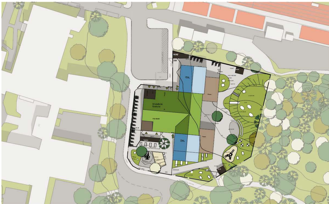
Förslag på gårdsytans disposition, utformningen kan komma att ändras. Illustration: Wi Landskap/Scharc arkitekter