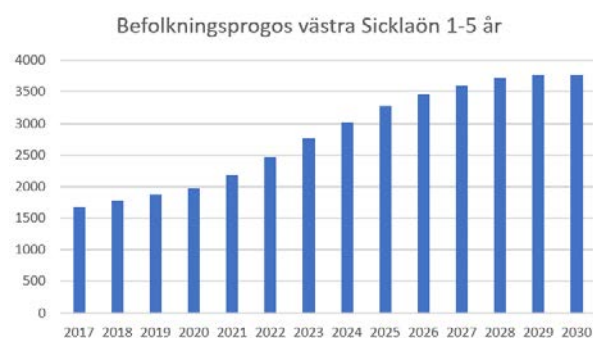
Diagram 1: befolkningsprognosen förskola 1-5 år, västra Sicklaön