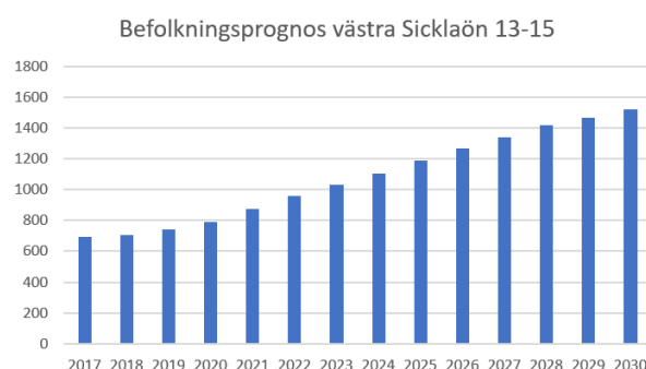
Diagram 3: befolkningsprognos 13-15 år, västra Sicklaön