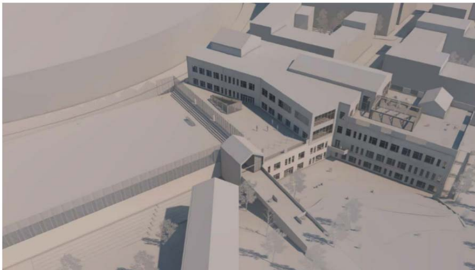
Volymstudie och idéskiss på skolan och idrottsbollar med bollplan på taket sedd från skolgården, Scharc Arkitektur

Sickla skolområde ingår i detaljplan Sydvästra Plania på västra Sicklaön. Det förtätade området och den ökande befolkningmängden medför ett ökande behov av skol- och förskoleplatser i alla ålderskategorier. Det finns även ett stort behov av idrotts- och fritidsanläggningar. Sickla skola, förskola och gymnastikhall är idag centralt placerad i Sicklaområdet. Skolan bedriver F-6 verksamhet i tre parallella årskurser samt grundsärskola (cirka 550 elever). Sickla förskola Växthuset är idag inrymda, dels i en paviljongbyggnad med cirka 80 barn, samt cirka 30 förskolebarn i ena skolbyggnaden, på totalt sex avdelningar (cirka 110 barn). Idag finns en specialanpassad idrottshall för gymnastik och en 7-spelarplan.