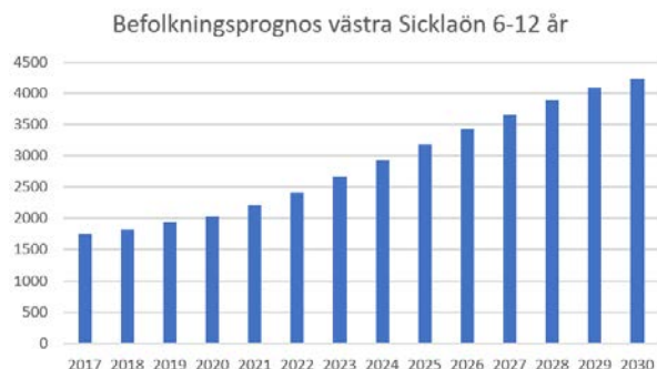
Diagram 2: befolkningsprognos 6-12 år, västra Sicklaön