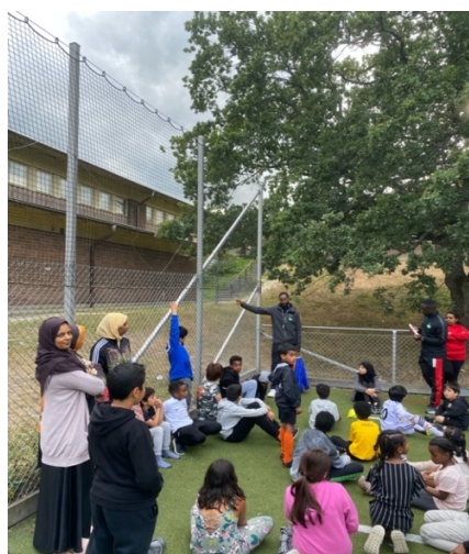
Utomhusaktivitet vid Lännbo BP Hösten 2020

En Frisk Generation arbetar vidare med att hitta kontakter och samverkan med lokala bostadsbolag i Orminge.