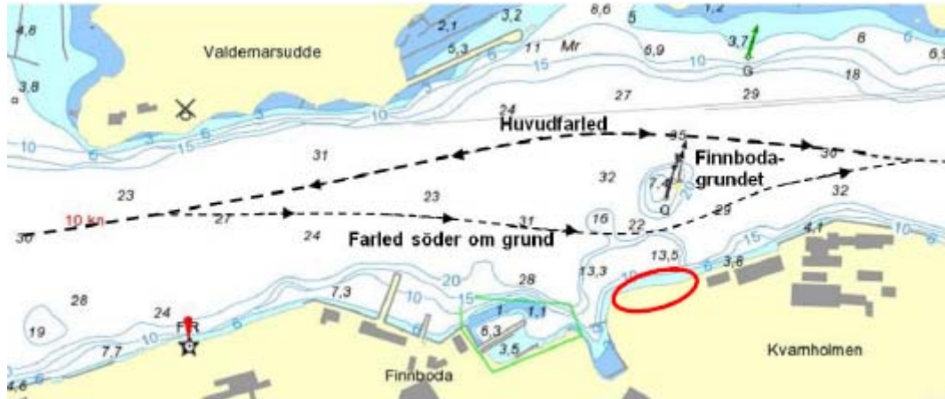
Sandhamnsleden utanför Kvarnholmen (Riskbedömning avseende påsegling Kvarnholmen DP 5, WSP 2014-09-19)

Promenadstråk och liknande, där personer som vistas kan förväntas ha god uppsikt och bli medvetna om en eventuell fara i tid, bedöms vara acceptabelt.