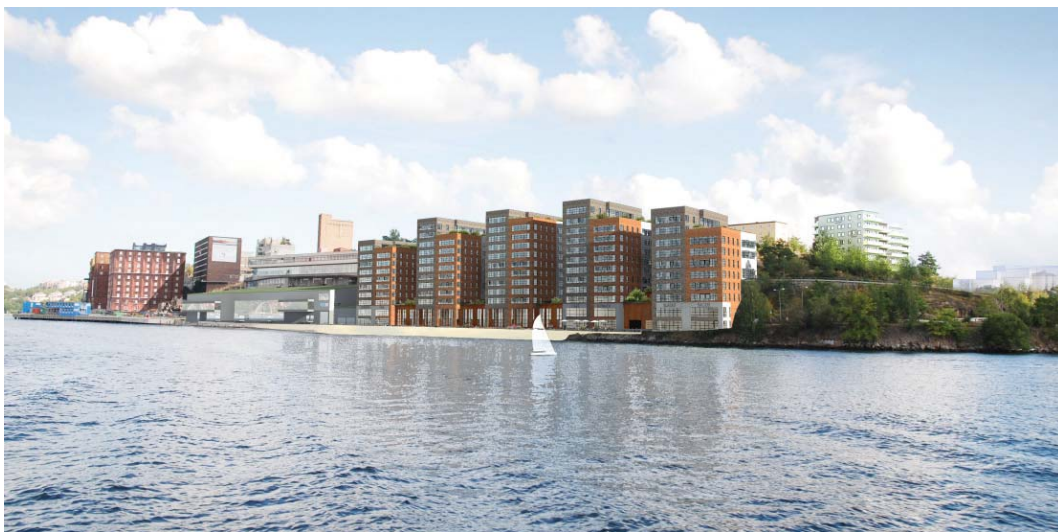
Norrhusen, nordvästra kajen, vy mot sydost

Upprättad på miljöenheten i september 2014, reviderad december 2014