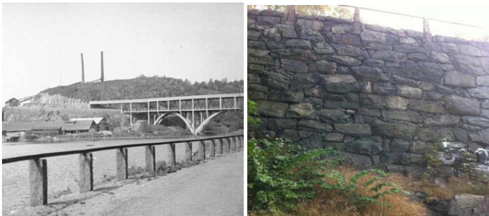
Dubbelbron invigdes 1932. Den övre delen som trafikförsörjde bostadsområdet revs dock 1985. Kvar finns ett kallmurat brofäste, beläget inom planområdet.

Det övergivna brofästet, strax söder om planerade punkthus, med omsorgsfullt kallmurade sidor bevaras som utsiktspunkt. Den höga konstruktionen är en historisk lämning med stor betydelse för entrén till ön. Förutom miljöskapande värden kan den minna om att Kvarnholmsbron har haft en övre vägbana från 1932, riven 1985.