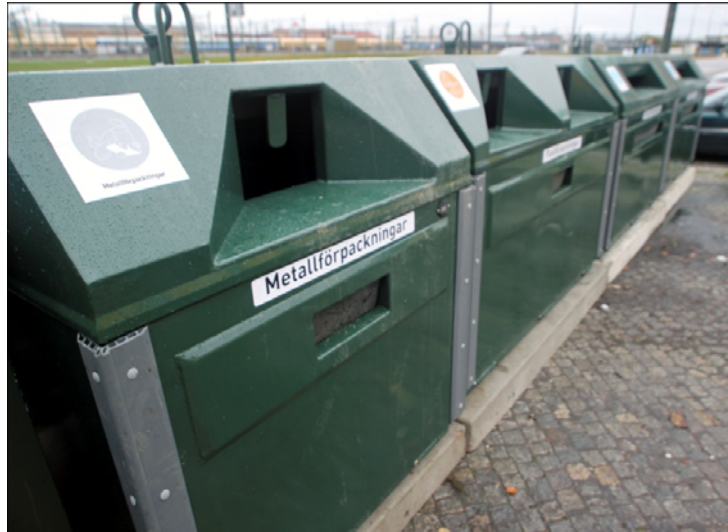
Exempel på krantömmande behållare.

Redan idag har nya behållare placerats ut på återvinningsstationen. Alla behållare är nu krantömmande och i mer enhetligt utförande. Vissa behållare byts ut successivt beroende på gällande avtal. En ny typ av ljuddämpande glasbehållare finns framtagen och kan komma att placeras ut. Dessa behållare dämpar ljudet som uppstår när förpackningar lämnas i behållaren.