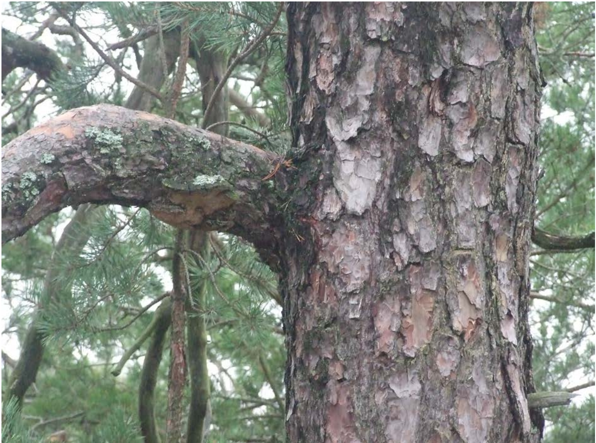
Slät pansarbark och grova grenar med parasiterande tallticka visar på tallars höga ålder.

Området ligger i anslutning till både skola och dagis och utnyttjas flitigt för exkursioner. Genom skogen löper även äldre, stenlagda stigar.