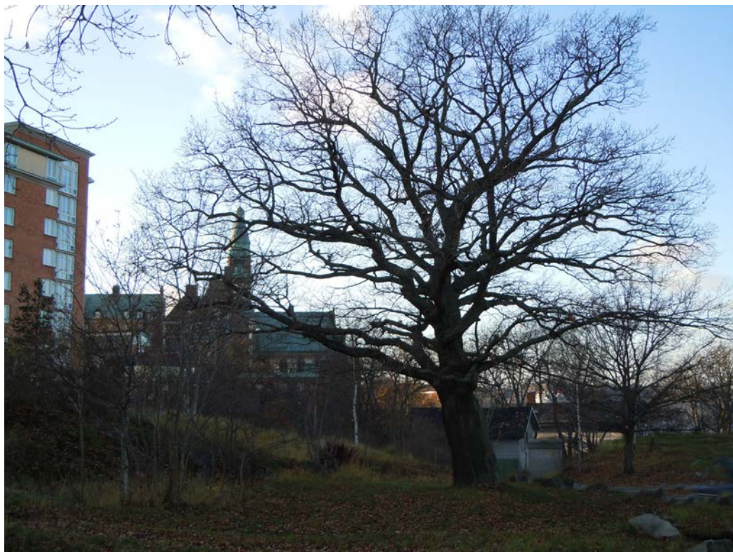
Områdets grövsta ek med Danvikshem i bakgrunden. Gamla ekar saknas fö i området.

Utbredningen av naturvärdesträd och fördelningen av trädslag framgår av karta i bilaga 1. Bilaga 1 visar också delområden som skiljts ut i inventeringsområdet. Beskrivning av delområden och naturvärdesbedömning av dessa finns redovisade i bilaga 2. Bilaga 3 visar karta över värdträd för rödlistade arter. Tabell för samtliga naturvärdesträd med tillhörande signal- och rödlistade arter är bilaga 4.