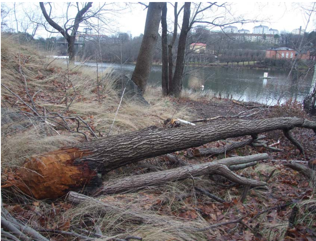
Nya inslag nedanför Henriksdalsberget senaste decenniet; G/C-vägen dragen nära stranden mot Svindersviken och en säl fälld av bäver. Vägen innebar att 100-tals lövträd fälldes.