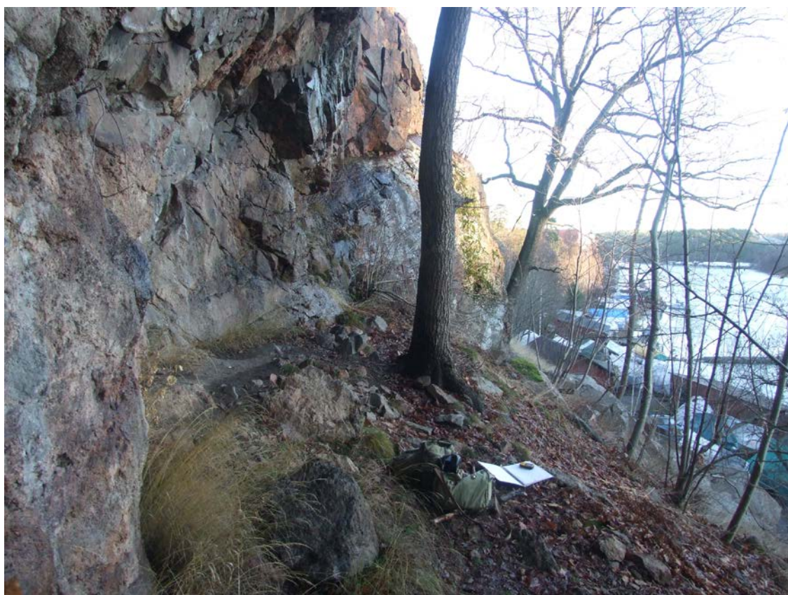
Henriksdalsbergets brantaste del där den småväxta ormbunken murruta växer i klippsprickor. Lägg märke till i berget inslagna järn som används av bergsbestigare.