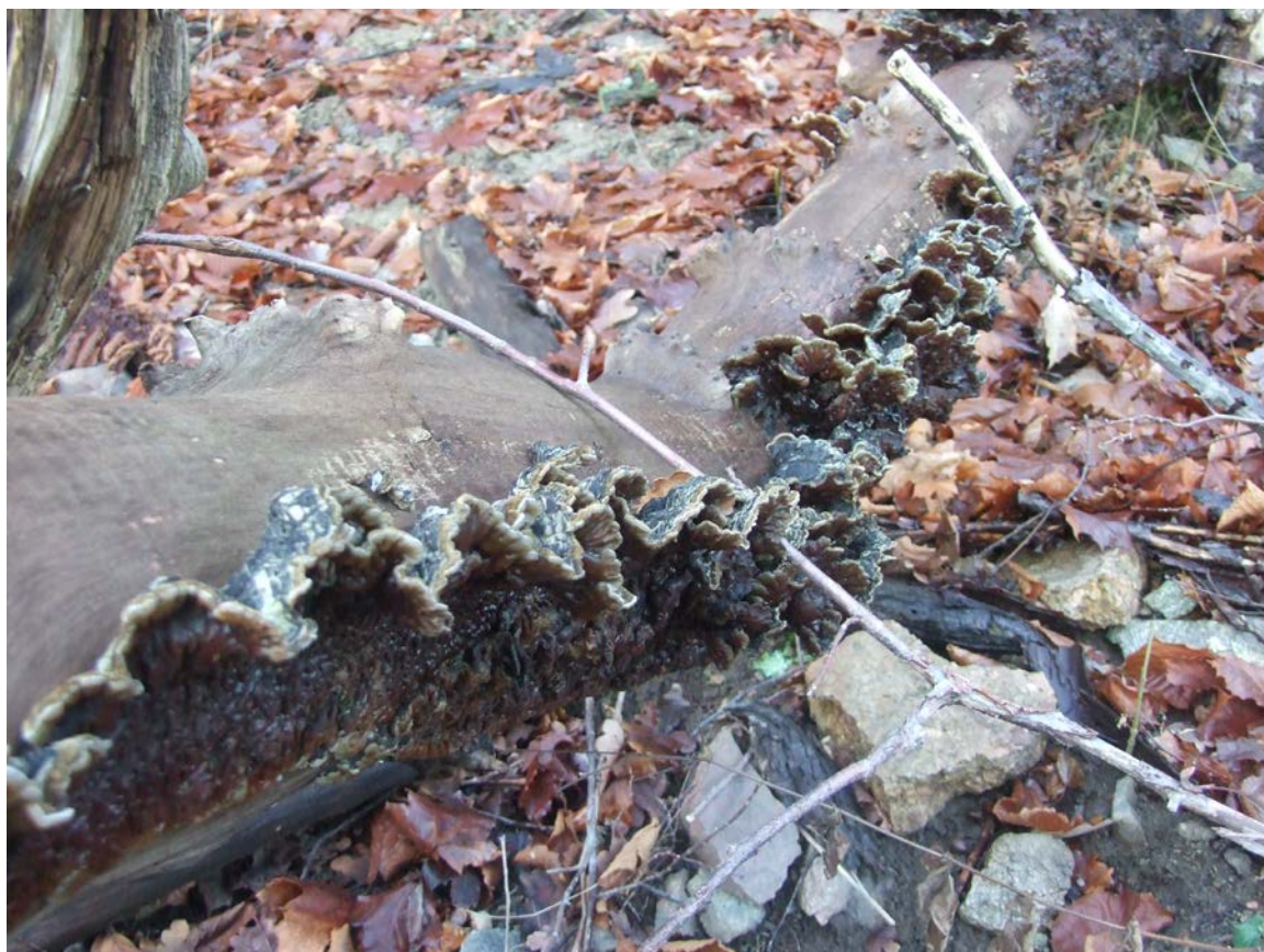
Vedsvampen svartöra växer på död alm vid Henriksdalsbergets brant. Arten har rödlistats i Sverige som följd av att almens fortlevnad hotas av almsjuka.

Värdträdens arter är nästan samtliga vedsvampar som är rödlistade eller signalarter. En handfull arter av svampar och skalbaggar är knutna till tall. 80 % av fynden utgörs av tallticka. I övrigt gjordes ett fåtal fynd av svamparna grovticka och vintertagging samt skalbaggarna svart praktbagge och reliktböck. Dessa båda noterades med hjälp av gnagspår. Bland lövträden noterades enbart tre värdträd, dels en död asp (rävticka) och död alm (svartöra) samt en mycket gammal och ihålig klibbal där dess håligheter med mulm kan antas vara boplats åt krävande arter av vedinsekter. Fler värdträd bland lövträden skulle upptäckts om inventeringen gjorts vid annan årstid. Totalantal fynd av rödlistade eller signalarter var 55.