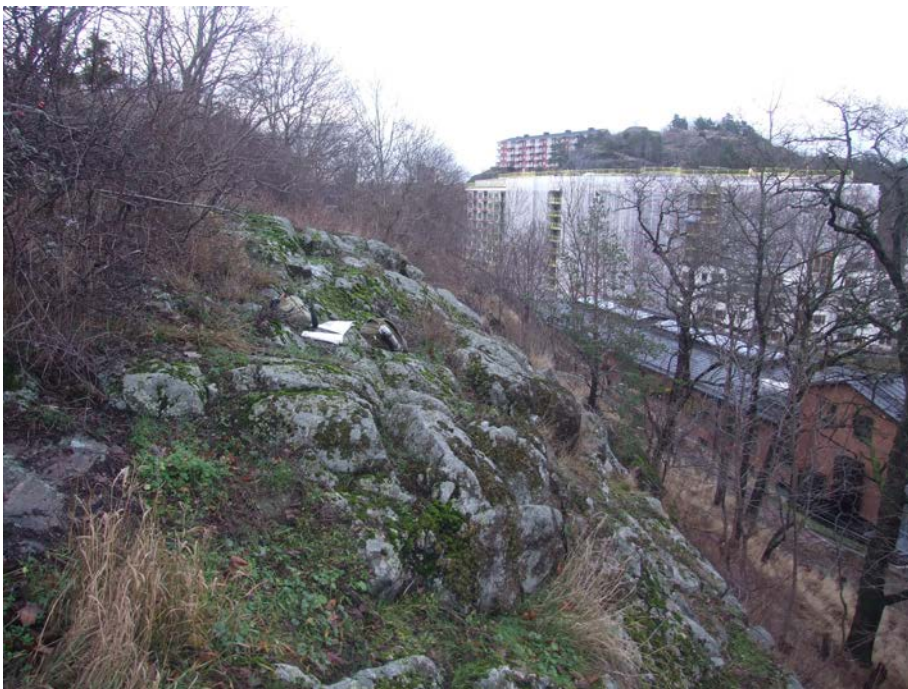
Sydvänd, buskklädd klippa där flora och fauna bör inventeras närmare sommartid.

Fördjupad inventering behöver ske under sommarhalvåret i flera av delområdena. Markfloran inom delområde 1 (branter, sprickdalar, hållar och strandnära lövskogar), 7 och 8 (branter) bör dokumenteras under vår-försommar. Öppna hållar utanför delområdena bör också inventeras. Om möjligt kan även insektslivet undersökas översiktligt eller med hjälp av fällor. Perioden bör utsträckas under hela sommaren.