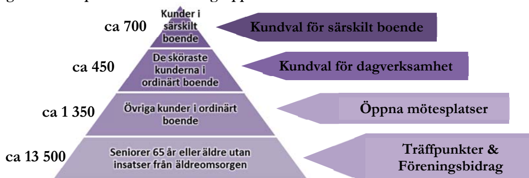
Figur 1. Mötesplatser för olika målgrupper

Figur 1. nedan beskriver vårt förslag på hur Nacka kommun på en övergripande nivå kan möjliggöra för olika målgrupper att ta del av hälsofrämjande aktiviteter.