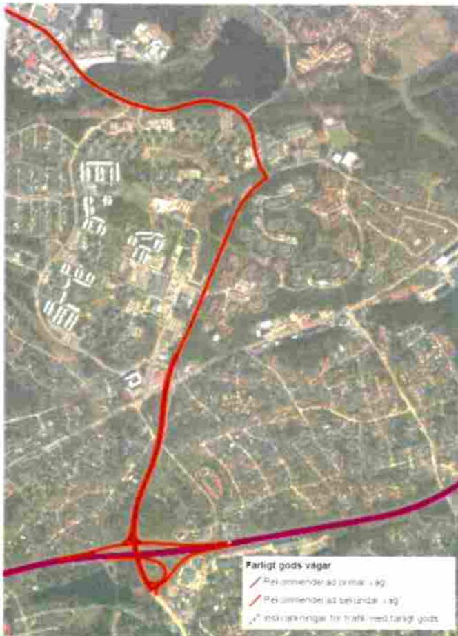
Rekommenderade vägar för farligt gods