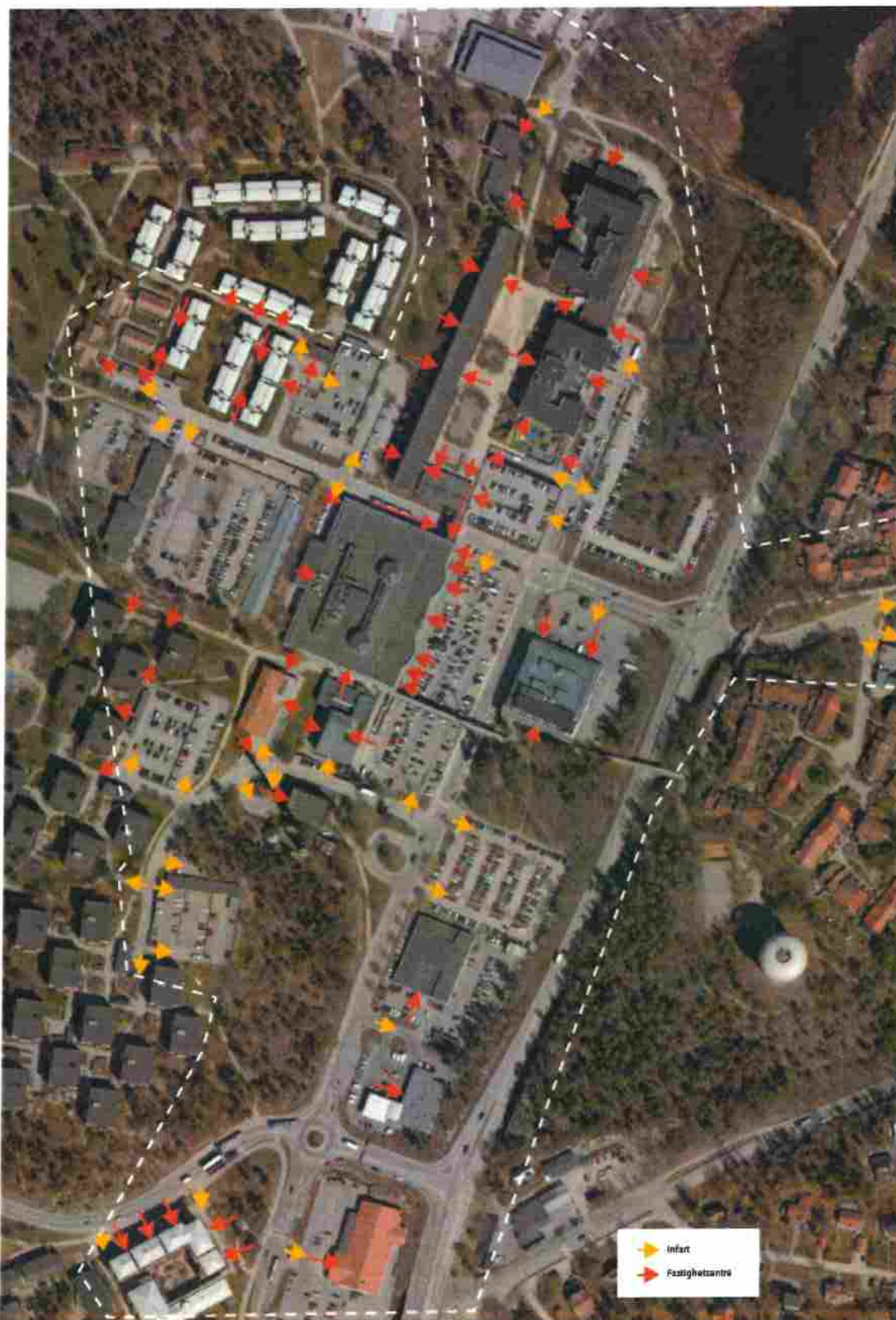
Översiktlig vy över infarter och fastighetscentréer.