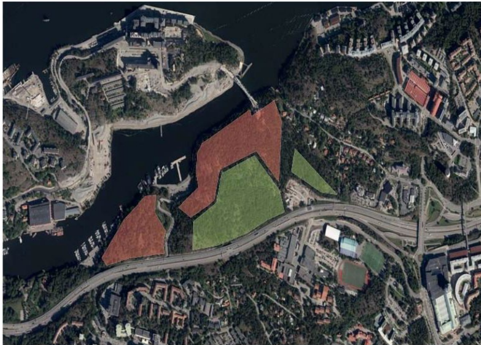
Flygfoto över Ryssbergen med Kvarnholmen.