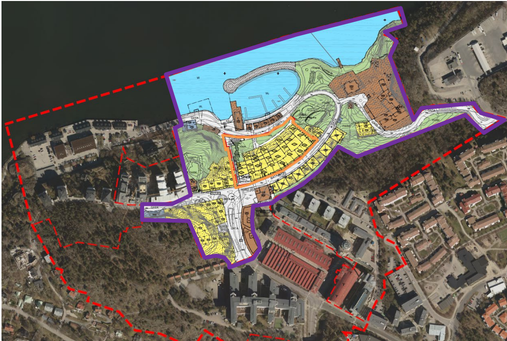
Figur 1. Norra Branten, delplan 1 visas i orange. Norra Nacka strand, detaljplan 3 ses inringat i lila.