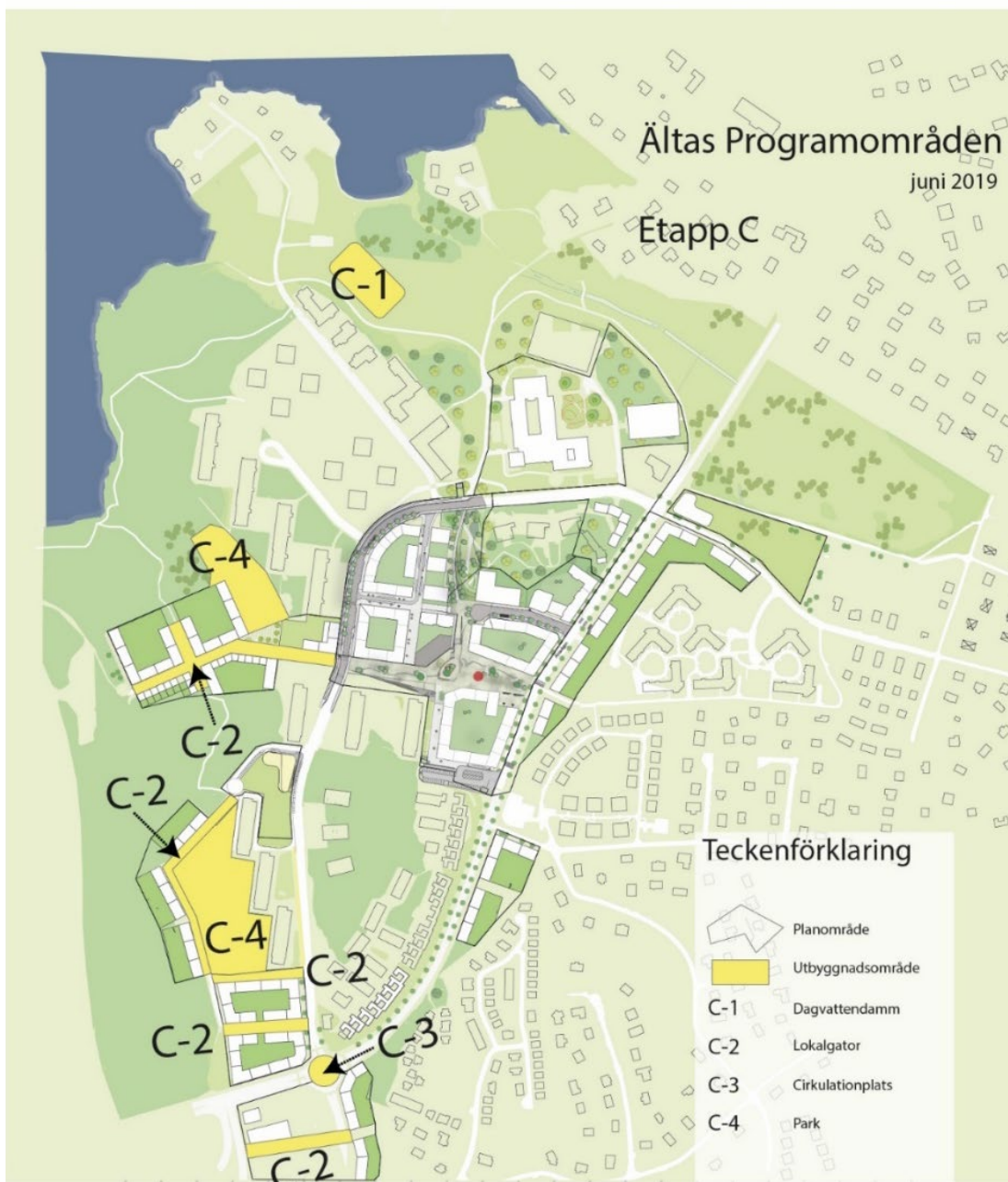
Figur 4, utbyggnad av kommande etapper, etapp C

Ombyggnad av befintliga parker för att tillskapa mervärden för fler.