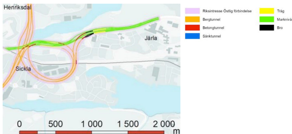
Bild 1. Utbredningen av riksintresset för Östlig förbindelse vid trafikplats Värmdövägen

År 2016 utredde Trafikverket Östlig förbindelses troliga effekter på miljön, detta som underlag inför Länsstyrelsens beslut huruvida Östlig förbindelse bedöms innebära betydande miljöpåverkan eller inte. Effekter på exempelvis stads- och landskapsbild, kultur- och naturmiljö, påverkan under byggtid, buller och klimat studerades. Beslut togs av Länsstyrelsen att projektet innebär betydande miljöpåverkan vilket medför att höga krav ställs på fördjupade utredningar kring miljöpåverkan. År 2017-2018 arbetade Trafikverket med en lokaliseringstudie där olika sträckningar och alternativa lösningar för trafikplatser utreddes. Arbetet med en miljökonsekvensbeskrivning (MKB) påbörjades parallellt med lokaliseringstudien. Den trafiklösningen som Trafikverket förespråkade i Nacka innebär att anslutningen mellan Värmdöleden och Östlig förbindelse skulle ske under mark med tunnlar under bland annat Finnboda, Henriksdal, Svindersviken och Sickla. Se utbredningen av ungefärligt område för Östlig förbindelse i bild 1 nedan.