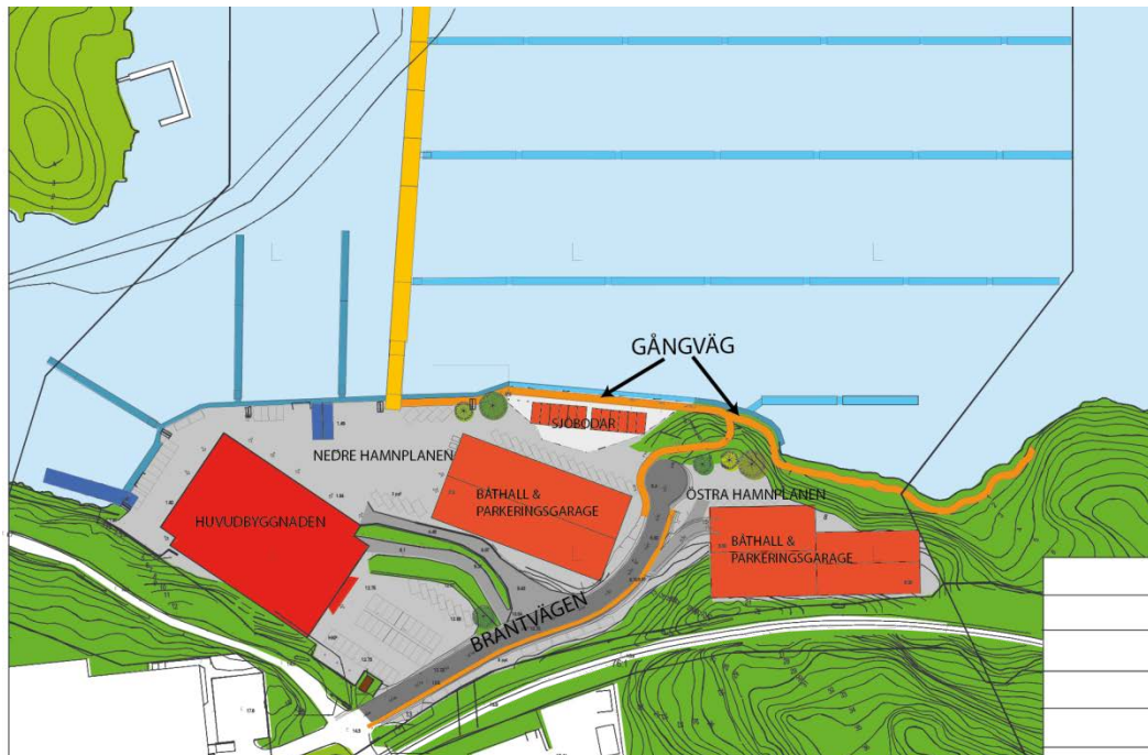
Brantvägen och gångväg som tillsammans med piren föreslås bli allmän plats.

De olika verksamheterna inom marinan förväntas ha olika parkeringsbehov som dessutom varierar beroende på veckodag och säsong. För plan 1-2 har nuvarande verksamheter använts som utgångspunkt för p-tal. För plan 3 är verksamheten ännu oklar men beräkningar har baserats på parkeringsbehov för kontor och småindustri. Plan 4-5 är avsett för restaurang, vandrarhem och museum.