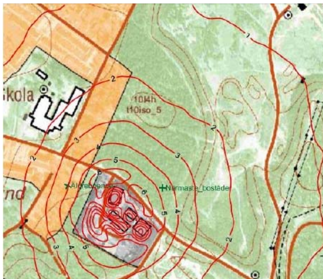
Figur 1. Här redovisas det beräknade haltbidraget av väteklorid som 98-percentil för timmedelvärden under ett år vid maximalt tillståndsgiven produktion. Enhet: \mu\text{g}/\text{m}^3 .

Slutsats: Gällande miljö kvalitetsnormer för luft kommer att klaras inom detaljplanområdet.