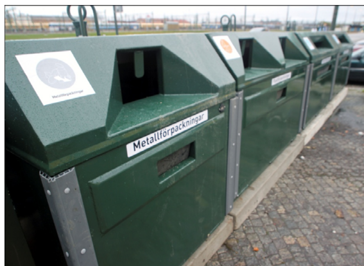
Exempel på krantömmande behållare.

Redan idag har nya behållare placerats ut på återvinningsstationen. Alla behållare är nu krantömmande och i mer enhetligt utförande. Vissa behållare byts ut successivt beroende på gällande avtal. En ny typ av ljuddämpande glasbehållare finns framtagna och kan komma att placeras ut. Dessa behållare dämpar ljudet som uppstår när förpackningar lämnas i behållaren.