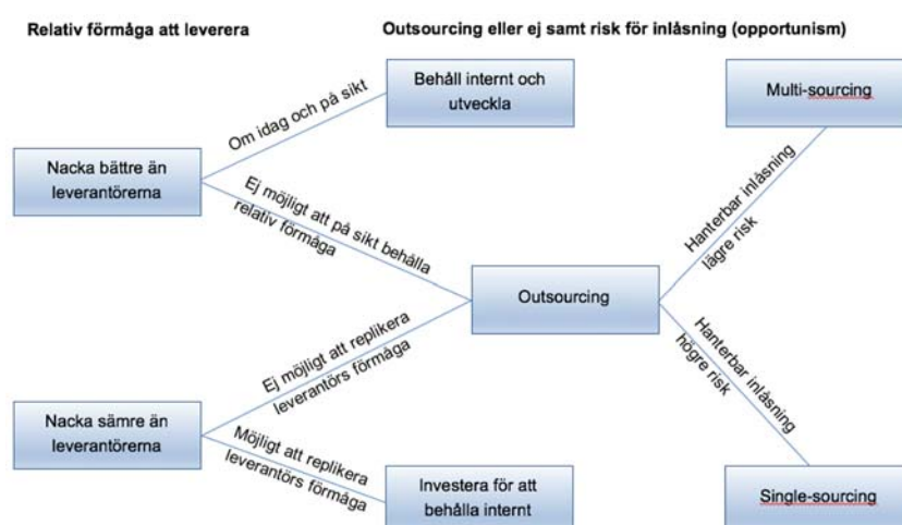
Figur 2 Nacka kommun anpassat flödesschema baserad på Mclvors flödesschema för outsourcing.

I bedömningen av lämpligheten för valet mellan egen drift alternativt outsourcing för respektive område (Nät, IT-drift, Säkerhet samt Telefoni) utgår vi från Ronan Mclvors flödesschema för sourcing, (What is the right outsourcing strategy for your process? Mclvor, R., 2008). Vi väljer dock att förenkla och anpassa Mclvors flödesschema för Nacka Kommuns situation med nedanstående resultat: