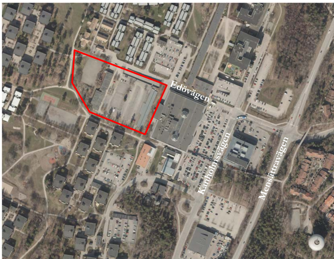
Flygfoto över Orminge centrum. Nybackakvarteret utmärkt med röd linje.