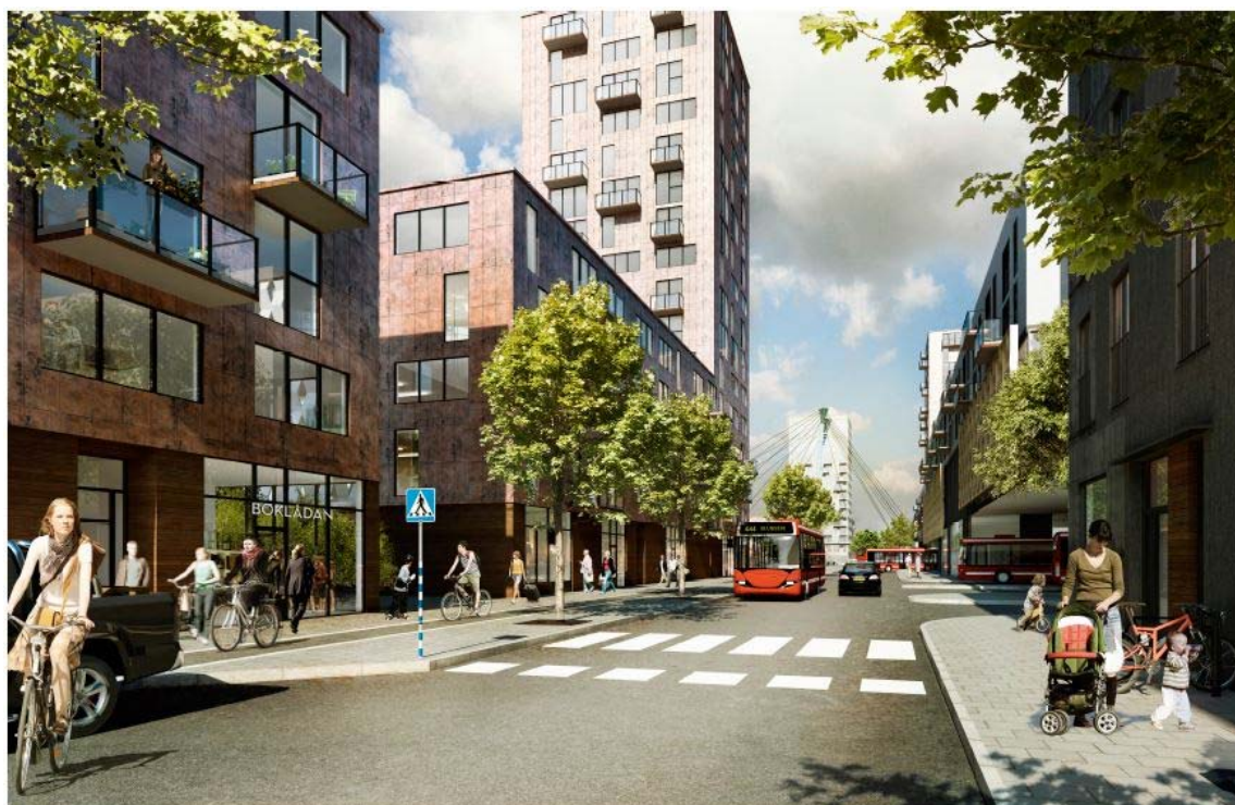
Illustration, södra delen av Kanholmsvägen, vy mot centrum. Bilden visar ett parkeringshus som kombinerar med bostäder i yttre delen av fasaden (se det lägre huset till vänster i bildens mitt).

Dialog och medskapande ska prägla utvecklingen i Orminge centrum. Liksom under programarbetet ska det ske i samarbete med fastighetsägare, exploatörer, besökare, omkringboende och kommande inflyttare.