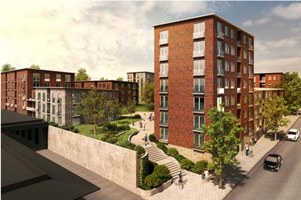
Nybackakvarteret i Orminge centrum. Idéskiss