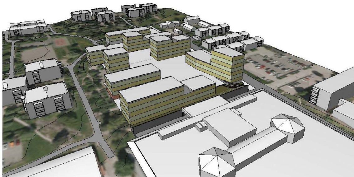
Volymstudie. Fågelperspektiv från sydost (Bild: ettelva arkitekter)

Ett gestaltungsprogram ska tas fram under detaljplanarbetet. Skisserna som presenteras här (se bilaga Volymstudie) ligger till grund för fortsatt arbete med detaljplan och ger en preliminär indelning i anbudsområden. Bebyggelsens omfattning, antal BTA, lägenheter samt anbudsområdenas avgränsning, kan komma att ändras under detaljplanarbetet.