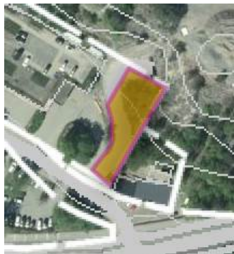
Område 1 – areal ca 700 kvm

Område 1 är i detaljplan prickad och får således inte bebyggas. Området belastas av servitut för väg, se kapitel 3.3. Fortsatt åtkomst till den övre delen av fastigheten förutsätts här kunna ske via den allmänna platsmarken 1 . Marknadsvärdepåverkan av arealförlusten bedöms som marginell. Marginalvärdet sätts till 5 procent av det bedömda genomsnittsvärdet eller 96 425 kr ( 0,05 \times 2\,755 \text{ kr/kvm} \times 700 \text{ kvm} ).