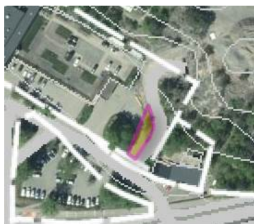
Område 2 – areal ca 230 kvm

Område 2 är i detaljplan prickad och får således inte bebyggas. Området belastas inte av servitut för väg, se kapitel 3.3. Pågående markanvändning utgörs till stora delar av en möjlighet till rundkörning i samband med ut- och inlastning till byggnaden samt in- och utfart till garage. I samband med aktuell marköverföring bedöms denna rundkörningsmöjlighet försvinna. Marknadsvärdepåverkan av arealförlusten bedöms vara högre jämfört med område 1 ovan. Dock inte av allvarlig art då funktionen (in- och utlastning respektive garage) fortfarande kan bedrivas. Byggrätten på fastigheten påverkas inte. Marginalvärdet sätts till 30 procent av det bedömda genomsnittsvärdet eller 190 095 kr ( 0,3 \times 2\,755 \text{ kr/kvm} \times 230 \text{ kvm} ).