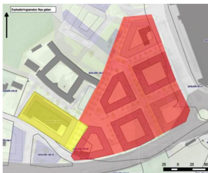
Förslag på ny markanvändning

För värderingsobjektet föreslås bostäder. Dock föreslås en mindre del bli gatemark - allmän plats i detaljplan (gulmarkerad med gråa prickar på karta nedan).