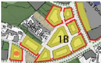
Etapp 1B i detaljplaneprogrammet för centrala Nacka

Markanvisningsområdet ligger visserligen centralt i Nacka men bedöms inte vara av strategisk betydelse för kommunen, varken utifrån kommunala välfärdsändamål eller andra ändamål. Området omfattas av etapp 1B i detaljplaneprogrammet för centrala Nacka.