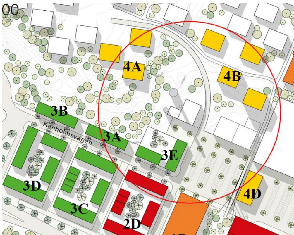
Figur 1 Planförslag med inritat skyddsavstånd på 200 meter.

I Boverkets skrift Bättre plats för arbete 6 anges ett flertal olika skyddsavstånd för Energianläggningar. För en fastbränsleeldad anläggning med en tillförd effekt på 10 MW föreskrivs ett skyddsavstånd på 200 meter. Samma bedömning har gjorts av Nacka kommun.