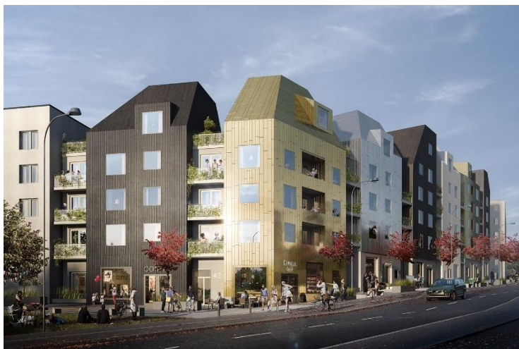
Förslag nummer 4 i Sammanställningslistan över inkomna bidrag (Sveafastigheter Bostad AB). Bidraget fick 95 "tumme upp".