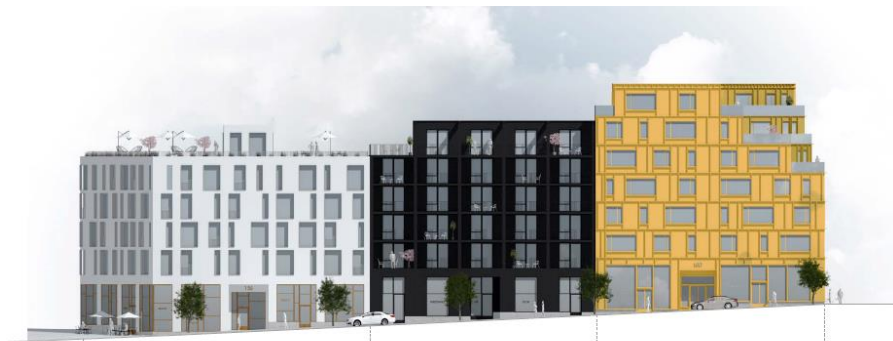
Kungsmontage Entreprenad AB/Enter Arkitektur: Fasad mot Värmdövägen