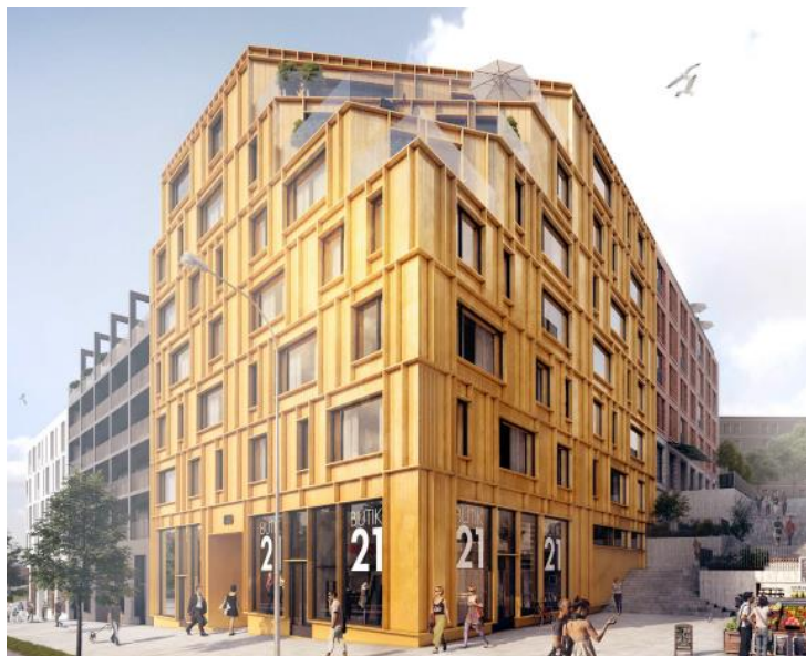
Kungsmontage Entreprenad AB/Enter Arkitektur: Hörnet mot sydost.