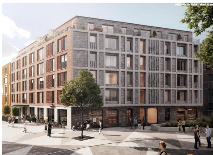
Kungsmontage Entreprenad AB/Enter Arkitektur: Hörnet mot norr, det övre torget.