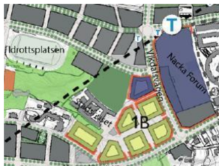
Etapp 1B i detaljplaneprogrammet för centrala Nacka

Området ingår i detaljplaneprogram för centrala Nacka, etapp 1B. Etappen skall vara färdigställd i slutet av 2025.