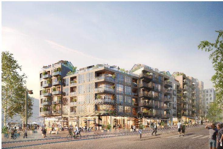
Förslag nummer 3 i Sammanställningslistan över inkomna bidrag (SSM Bygg & Fastighets AB). Bidraget fick 105 "tumme upp".