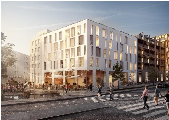
Kungsmontage Entreprenad AB/Enter Arkitektur: Bild till kommunens hemsida. Hörnet mot sydväst.

Kungsmontage Entreprenad AB:s anbud har i sin helhet kommenterats av utvärderingsgruppen: ”Ett väl genomarbetat förslag. Fin volymskapande gestaltning med stor variation inom kvarteret, även in mot gården. Fasaderna har egen identitet mot Värmdövägen, trappan och det övre torget. Mot det övre torget har fasaden fått en välartikulerad fasaddetaljering. Förslaget har flera unika element i både den lilla och stora skalan. Sockelvåningarna möjliggör ett levande innehåll och har anpassats väl i skala mot de olika omgivande stadsrummen.” Nedanstående bilder representerar förslagets gestaltning: