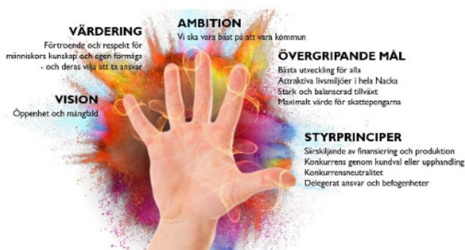
Illustration: Nacka kommuns styrmodell

Ställning kan bland annat behöva tas till om eller hur den befintliga styrmodellens olika delar redan stödjer en hållbar utveckling i samtliga tre dimensioner, eller om någon del behöver utvecklas med avseende på hållbar utveckling i enlighet med Agenda 2030. I den processen kan denna redovisning och kartläggning utgöra ett hjälpmedel.