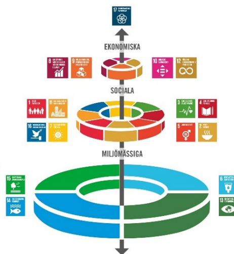
Illustration: Azote images för Stockholm Resilience Centre

En viktig överordnad princip för Agenda 2030 är att sträva efter en utveckling som tillfredsställer dagens behov men utan att äventyra kommande generationers möjligheter att tillfredsställa sina behov 15 .