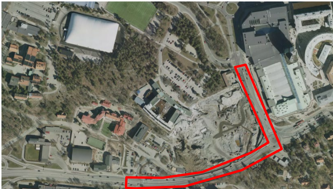
Karta som visar ett flygfoto över projektområdet för etapp 3, sträckan Vikdalsvägen/Griffelvägen till Värmdövägen/Lillängsvägen.

Projektering av bygghandling för etapp 3, sträckan Vikdalsvägen/Griffelvägen till Värmdövägen/Lillängsvägen pågår och kommer vara slutförd i juni 2020. Efter leverans av byggbar handling för etapp 3 planeras för utbyggnad med start under kvartal 3 2020 och fortsatt bygghandlingsprojektering av nästa etapp inom projekt Värmdövägen i enlighet med det beslut gällande genomförandeplan för stadsutveckling på västra Sicklaön som fattades av kommunstyrelsen den 30 mars 2020.