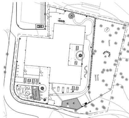
Inplacering av Kristallens förskola Systemhandling 2019

Projektering utfördes i enlighet med beställning, projektdirektiv och detaljplanen som vann laga kraft 2017. Under projekteringen söktes investeringsmedel för genomförande av byggprojektet med en ram om 99 miljoner kronor, vilket beslutades av kommunfullmäktige den 6:e november 2017 i Mål och budget 2018 - 2020, KF KS 2017/19.