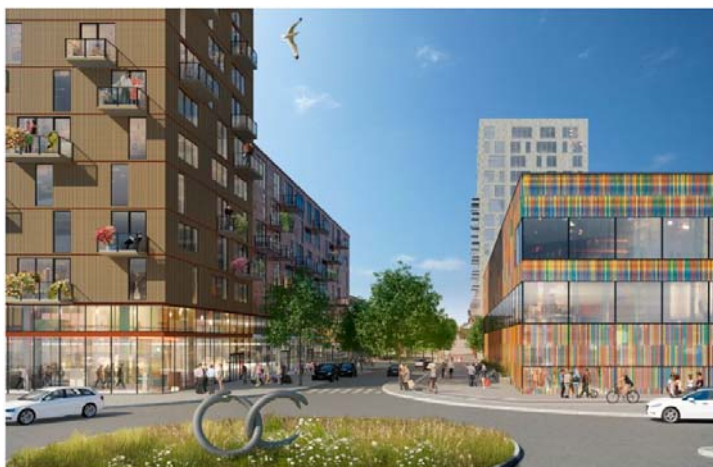
Illustration, vy från Persåstrången mot Sällvågen. En högre byggnadsform markerar den föreslagna entrén till centrum där tydliga stråk för gående och cyklistar skapas.