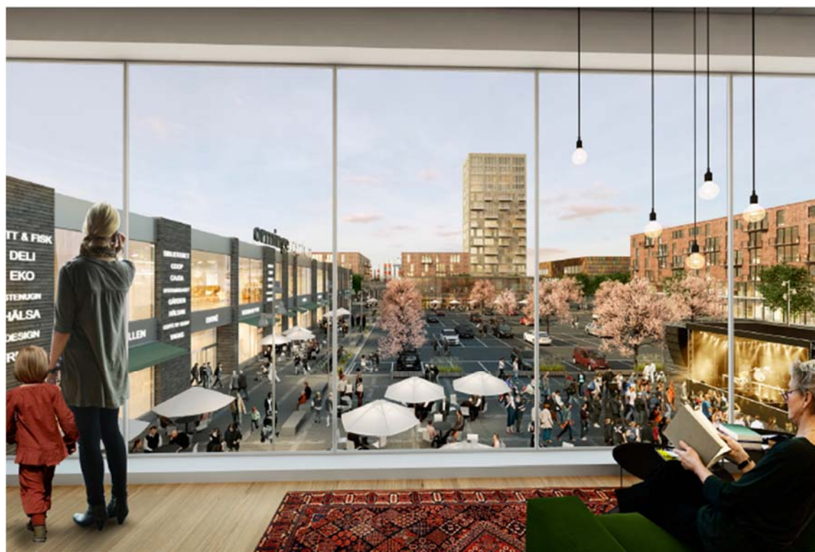
Idébild/illustration från detaljplaneprogrammet: Vy ut mot centrumtorget.

Dialog och medskapande ska präglade utvecklingen i Orminge centrum. Liksom under programarbetet ska det ske i samarbete med fastighetsägare, exploatörer, besökare, omkringboende och kommande inflyttare.