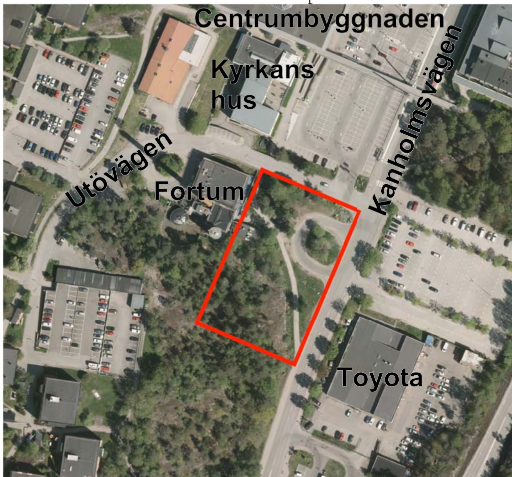
Flygfoto över Orminge centrum. Området för Parkeringshuset utmärkt med röd linje.

Parkeringshuset är en del av första etappen enligt planprogrammet för Orminge centrum. Parkeringshuset ligger mitt i centrala Orminge med närhet till centrumhusets affärsutbud, bussar till Stockholm och Värmdö samt Centrala parken.