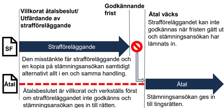
Figur 2 En ny ordning med möjlighet att utfärda strafföreläggande och samtidigt fatta ett villkorat åtalsbeslut

Det föreslås att det ska bli möjligt för åklagaren att utfärda strafföreläggande och samtidigt fatta beslut om ett villkorat åtalsbeslut. Åtalsbeslutet är villkorat av att den misstänkte inte godkänner strafföreläggandet. Stämningsansökan ges in till domstolen först när tiden för att godkänna strafföreläggandet har gått ut om den misstänkte inte godkänner det. Den misstänkte får del av strafföreläggandet och åklagarens stämningsansökan samtidigt. Det blir därför tydligare för den misstänkte vilka alternativ som finns. Eftersom stämningsansökan innehåller en redogörelse för vilken bevisning som åklagaren åberopar blir det lättare för den misstänkte att till ställning till frågan om strafföreläggande.