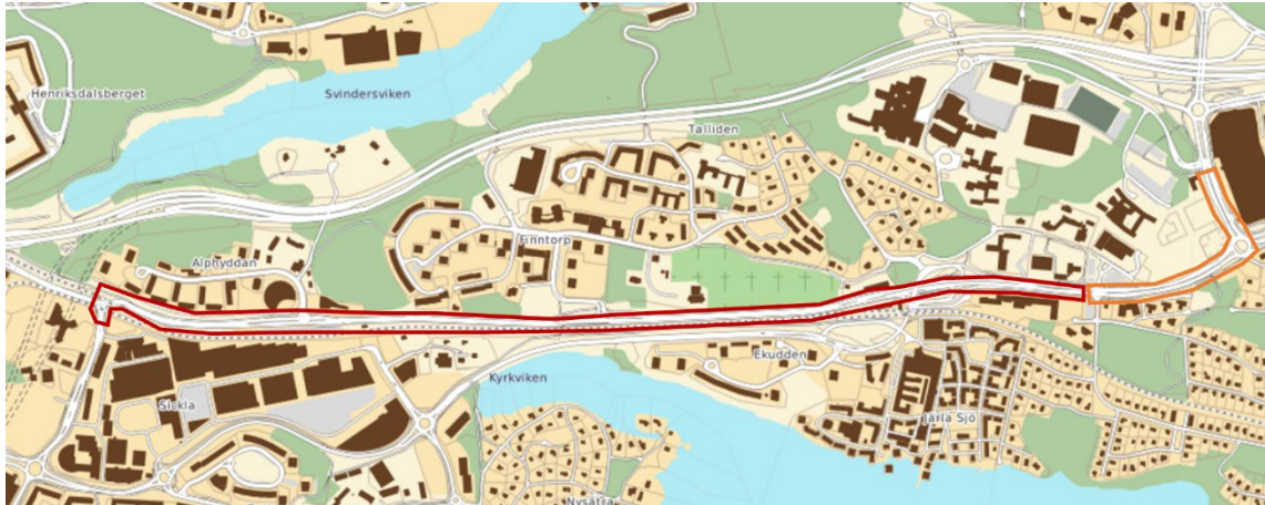
Tillkommande medel, enligt avgränsning i figur 2 ovan, miljoner kronor, tabell 1