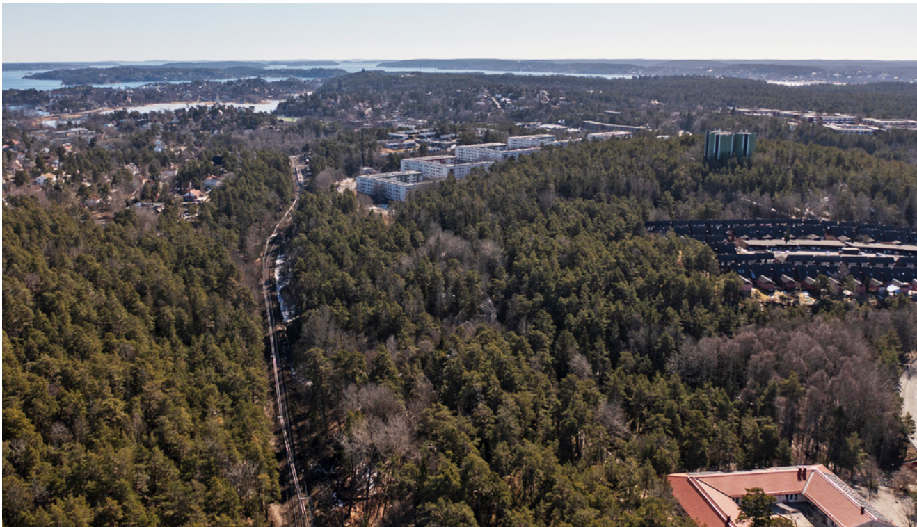
Vy över Igelboda, Saltsjöbaden