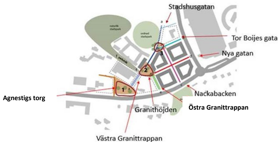
Figur 2 Väg- och platsnamn inom Detaljplan Nya Gatan Stadshusområdet och Detaljplan Nya Gatan Elverkshuset

Då produktionen av de allmänna anläggningarna sker etappvis har ett antal gator inom området Stadshusområdet börjat färdigställas och förväntas driftsättas av kommunen under hösten 2023. Under våren 2023 har produktionsstart skett av den Östra Granittrappan vilken förbinder och öppnar upp gångflöden mellan Värmdövägen och framtida Granithöjden inom Stadshusområdet. De allmänna anläggningar som kvarstår att bygga ut är de som har beroenden till byggaktörernas framdrift av bebyggelsen inom kvartersmarken.