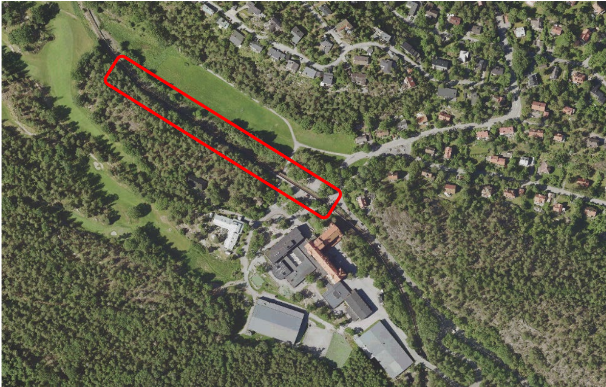
Bildtext: Karta som visar ett flygfoto över projektområdet.