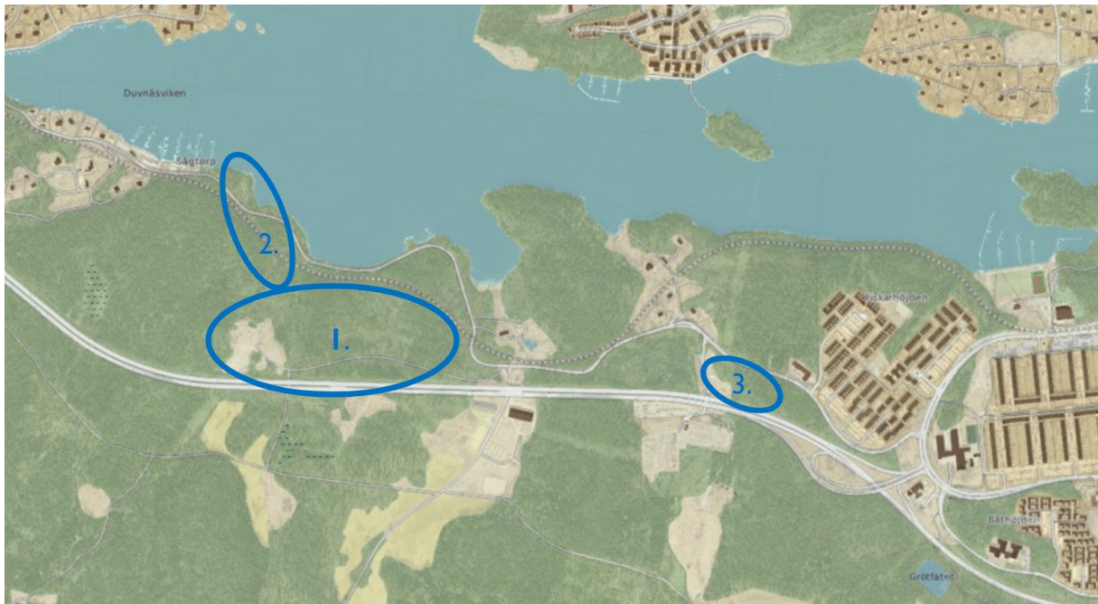
Figur 1. Karta som visar projektområdet samt delområden. Delområdena är markerade med blå cirklar: Gungviken, 1, transportväg och båtupptagning, 2, och Östervik, 3.