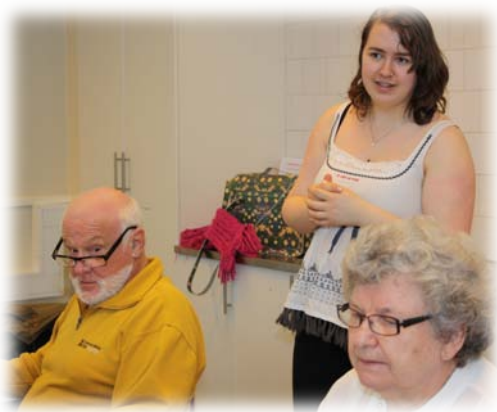
Gränsöverskridande möten, En gymnasieelev som hjälper äldre med datakunskap.

Under hösten fick jag en inbjudan att hålla en lektion om ideellt arbete på Kungsholmens gymnasium. Ett fullproppat klassrum där frågorna haglade och intresset var stort. Mycket uppskattat av både lärare och elever.