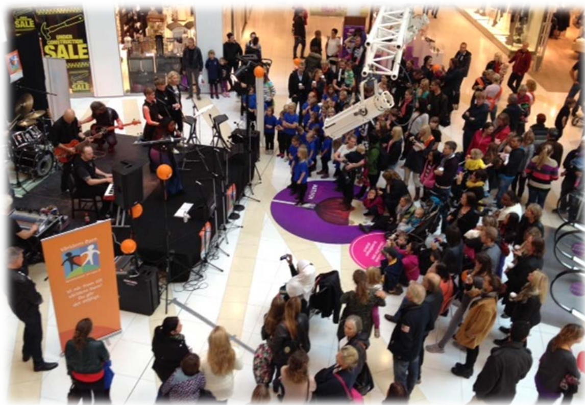
Världens Barn insamlingsevent i Nacka Forum

Sist men inte minst, att vara synlig och tillgänglig för kommunens invånare gynnar Volontär i Nackas verksamhet.