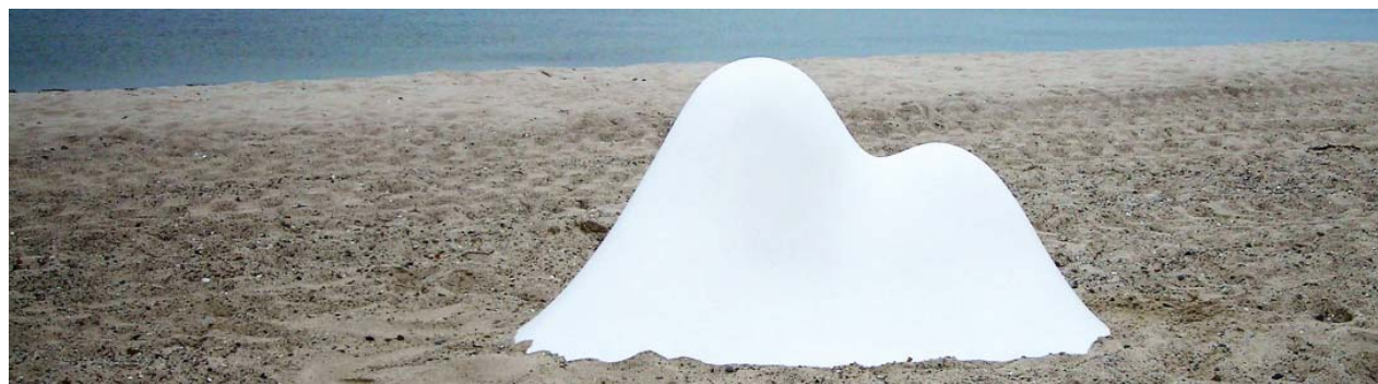
Bild 2. Berg av glasfibertäckt polyester.