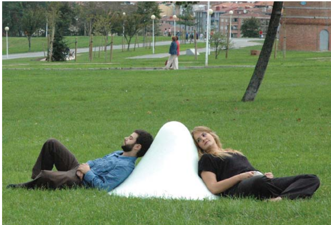
Bild 1. Ett litet berg att luta sig mot.