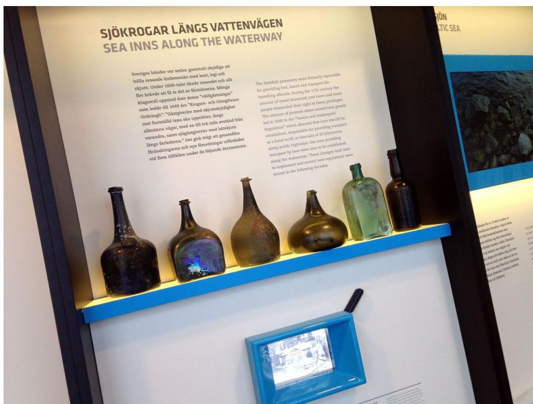
Samtliga bilder i rapporten är hämtade från http://hamnmuseum.se/varens-utstallning/

Källa: De vanligaste frågorna om HAMN, www.nacka.se . Läs mer på www.hamnmuseum.se