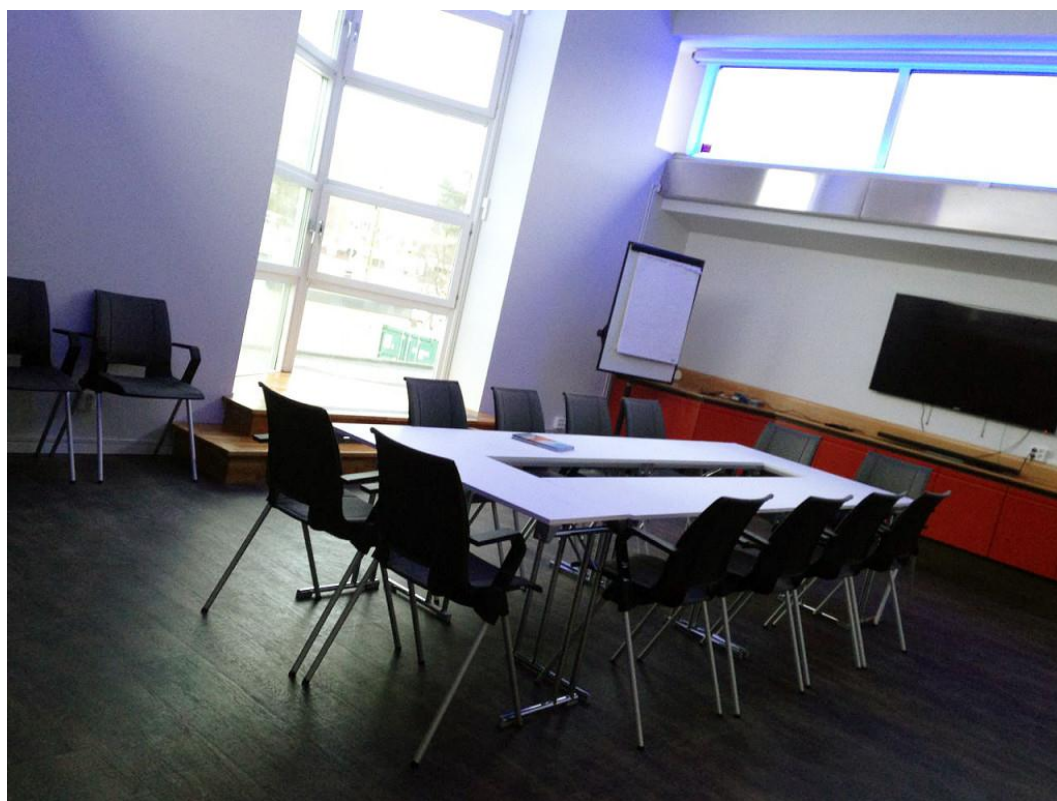
Bild 1. Möjligheter till konferens ryms också i museibygnaden.

En viktig del i projektet har varit samverkan med lokala och regionala aktörer inom utbildning, högskola, kulturarvsektor och besöksnäring, samt näringsliv och ideell sektor. Projektets målgrupper är boende i Fisksätra, arbetslösa, unga vuxna, företagare, utländska och inhemska turister, forskare, skolor, förskolor, boende och verksamma i Stockholmsregionen samt högskolor/universitet i och utanför Sverige.