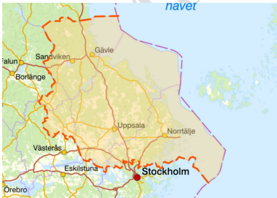
Bild 1. Översta bilden visar inre beredskapszon (röd linje) och yttre beredskapszon (blå linje) för Forsmark kärnkraftverk. Den undre bilden visar planeringszonen för Forsmark kärnkraftverk.

I den inre beredskapszonen bor endast 130 personer och i den yttre cirka 17 000.