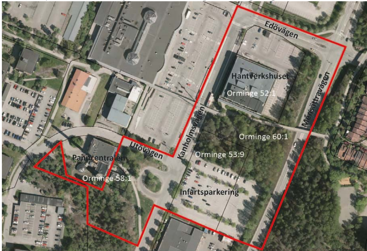
Ortofoto över projektets preliminära avgränsning i rött. Fastighetsgränser i svart.