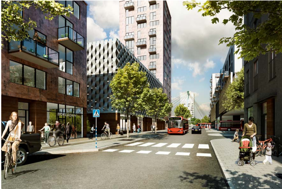
Illustration från antaget planprogram för Orminge centrum, södra delen av Kanholmsvägen, vy mot centrum. Bilden visar ett parkeringshus som synliggörs i stadsmiljön.