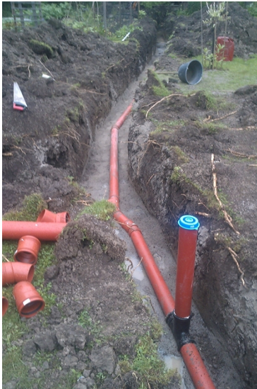
Bild 2. Dräneringsledningarna runt huset samt ner till brunnen