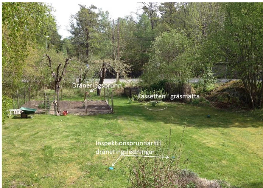
Bild B. Vy österut mot Smedjevägen

Länsstyrelsen kunde vid tillsynsbesöket konstatera att området är kuperat och att den aktuella fastigheten ligger i områdets lågpunkt. Vägen där kommunens dagvattenbrunn finns, ligger ca en meter ovanför tomten och fastighetens egen dräneringsbrunn.