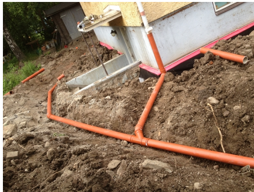
Bild 4. Dagvattenledningarna från stuprören till kassetten i gräsmattan