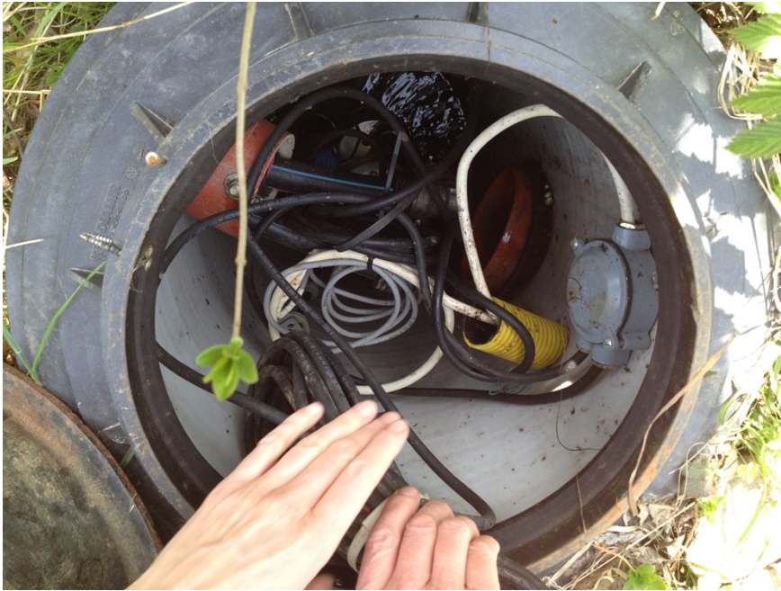
Bild C. Dräneringsbrunn med tillrinningen från höger och utloppet till vänster, mot gatan.

Åsa Ekberg har kompletterat handlingarna med en ritning och bilder för att illustrera bl.a. att dräneringsvatten och stuprörsavledningar har separata ledningar, bild 1- 5.