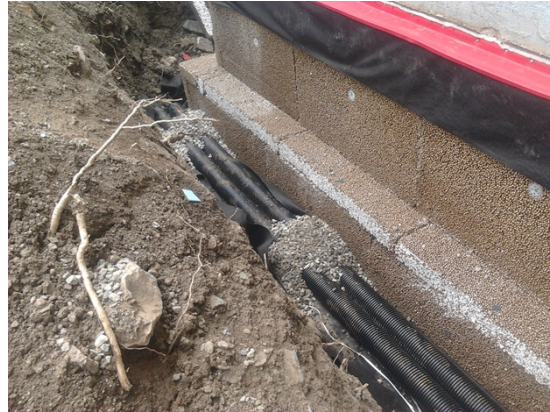
Bild 3. Dubbladräneringsrör runt huset