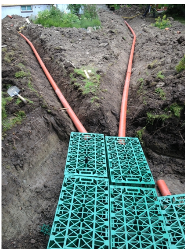
Bild 5. Kassetten i gräsmattan

Av bilderna ovanför framgår att dräneringsledningarna är lagda på lägre nivå än dagvattensystemet vilket tyder på att det är två skilda system.