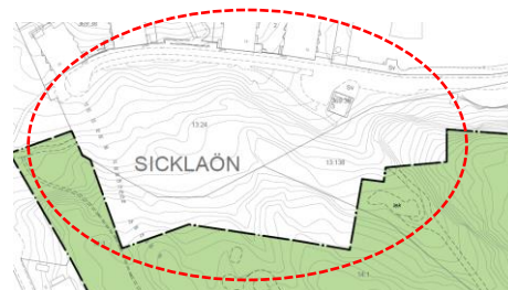
Utsnitt från aktuellt planförslag som redovisar planförslagets avgränsning mot Fabrikörvägen och delområde 6.