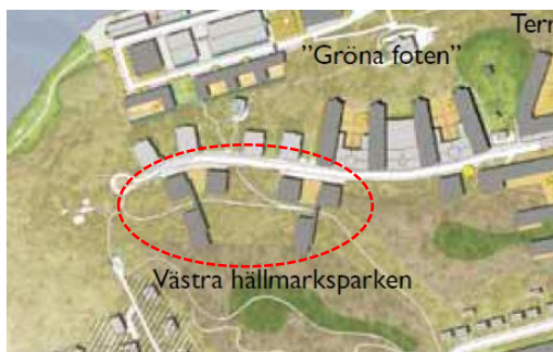
Utsnitt från detaljplaneprogrammet för Nacka strand. Delområde 6 är markerat med röd streckad linje.

Planenhetens uppdrag är att pröva bebyggelse i enlighet med det antagna detaljplaneprogrammet för Nacka strand. Som Brf. Gustafshög 1 skriver i sitt yttrande så ingår delområde 6, föreslagen bebyggelse söder om Fabrikörvägen i detaljplaneprogrammet (se bild nedan), i den angränsande detaljplanen för Västra Nacka strand, detaljplan 5. Inom ramen för detaljplan 5 kommer markens lämplighet för bebyggelse i enlighet med programmets intentioner att prövas i kommande detaljplaneprocess. Planenhetens bedömning är att avgränsningen av parkmarken inom aktuell detaljplan (se bild nedan) ger god marginal för detta. Detaljplan 5 är i ett startskede och har inte varit på samråd ännu. Samordning har skett mellan aktuell detaljplan och detaljplan 5 avseende gränsdragningar.