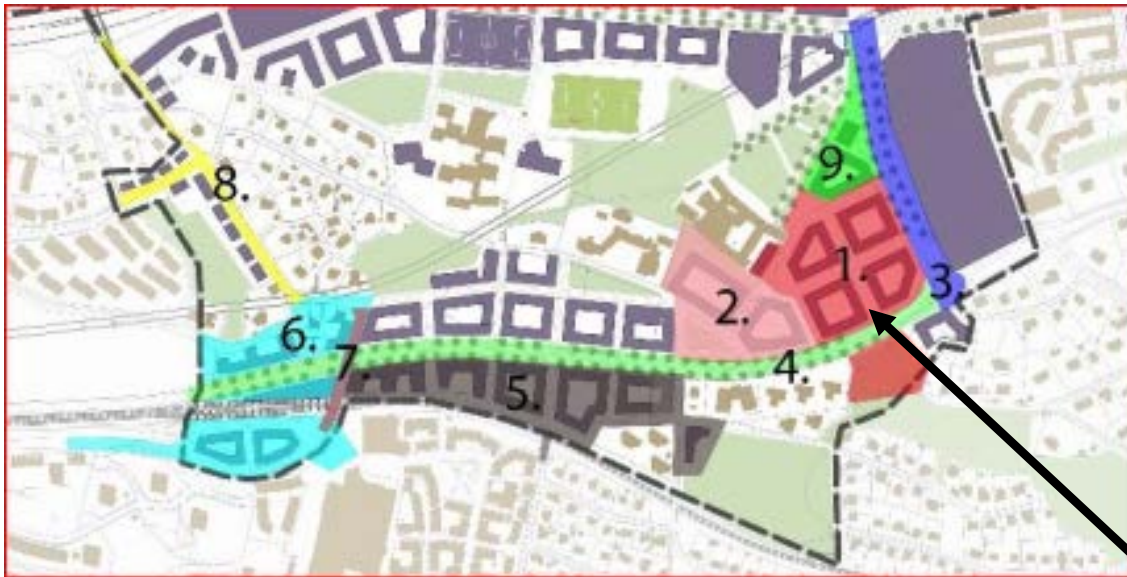
Bild 2, samverkansentreprenadens utbredning nr 1-9. Nr 1 är Nya gatan stadshusområdet, markerad med en svart pil.

Samverkansentreprenadens syfte är att samordna samt genomföra projektering och utbyggnaden av allmänna anläggningar inom nio olika områden, där Nya gatan utgör ett av dessa områden. Se bild 2.