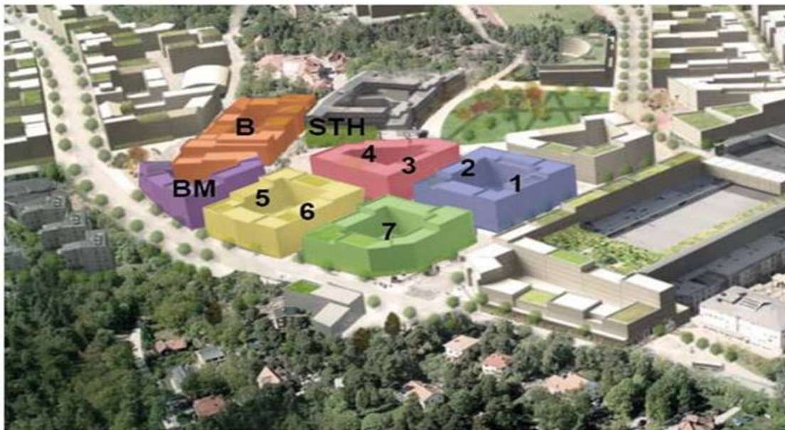
Bild 4, kvartersindelning och aktörer Nya gatan. 1-7

Mörkgrön = Nacka kommun, utbyggnad stadshuset