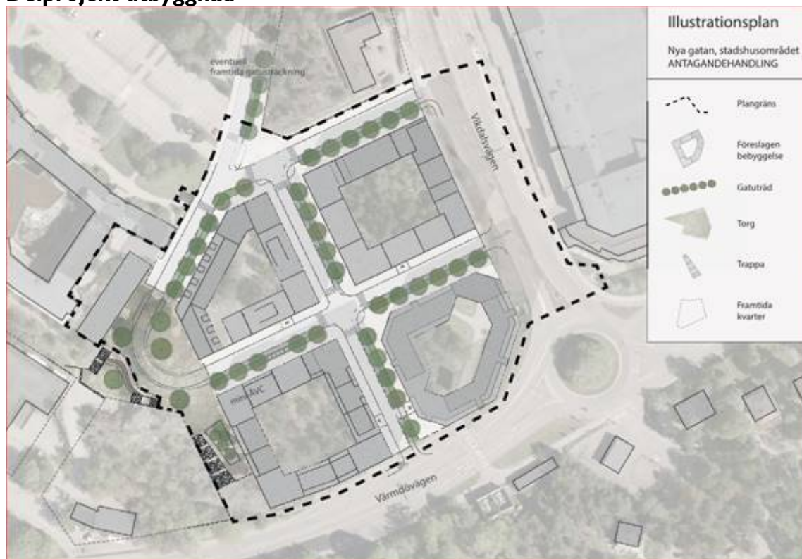
Bild 5, illustrationsplan Nya gatan. Kvarter samt allmänna anläggningar

Samverkansentreprenören bygger ut allmänna anläggningar åt stadsbyggnadsprojektet Nya gatan, kallat fas 2.