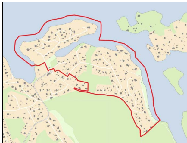
Planområdets läge i Nacka kommun, respektive planområdets avgränsning