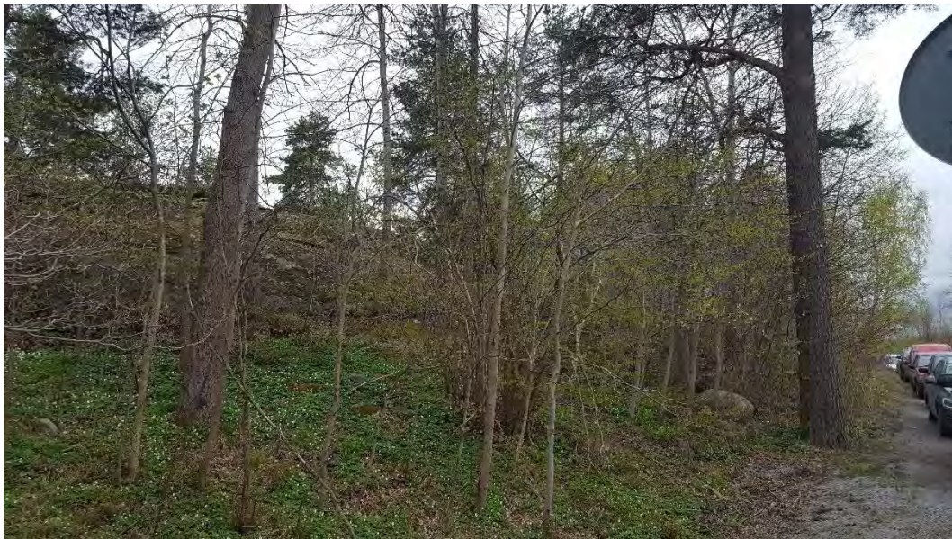
Figur 8. Hassel, asp och en av de grova tallarna i naturvärdeobjekt 3.

Bedömning: Naturvärdesobjektet bedöms att ha ett påtagligt naturvärde: Objektets biotopvärde bedöms som påtagligt och består främst av blommande och bärande träden samt de grova asparna där en av asparna är ett boträd för fåglar. De äldre tallarna är ett viktigt substrat för kryptogamer och insekter. Även äldre grova aspar är en viktig livsmiljö för många arter och kan erbjuda bohålor till fåglar. Naturvärdesobjektet bedöms att ha ett visst artvärde i form av ett artrikt busk- och trädskikt.