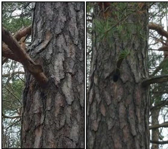
Figur 6. Tall i objekt 1 med tallticka samt bohål.

Objektets bedöms ha ett påtagligt biotopvärde i form av äldre tallar och blommande och bärande träd och buskar. Äldre tallar är viktiga livsmiljöer för kryptogamer och insekter. Äldre tallar med bohål är en viktig livsmiljö för många småfåglar och blommande och bärande träd och buskar är viktiga för fåglar och pollinerande insekter. Vi har valt att presentera de skyddsvärda träden som en del av naturvärdesobjekten samt som egna naturvärdesobjekt (se särskilt skyddsvärda träd, Figur 17, Tabell 2). Naturvärdesobjektet bedöms att ha ett visst artvärde som utgörs av den rödlistade arten tallticka (NT).