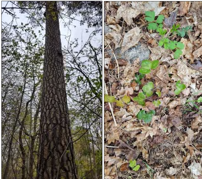
Figur 14. Tall med tallticka (NT) och blåsippa i naturvärdesobjekt 9.

Objektet biotopvärde bedöms som visst och består främst av gamla grova tallar som står delvis soligt och öppet och med fynd av tallticka. Grova äldre, både levande och döda tallar i öppna solbelysta miljöer gynnar många insekter och kryptogamer. Blommande och bärande träden och buskar är viktiga för pollinerande insekter. Naturvärdesobjektet bedöms att ha ett visst artvärde i form av en den rödlistade arten tallticka (NT) och den fridlysta blåsippan.