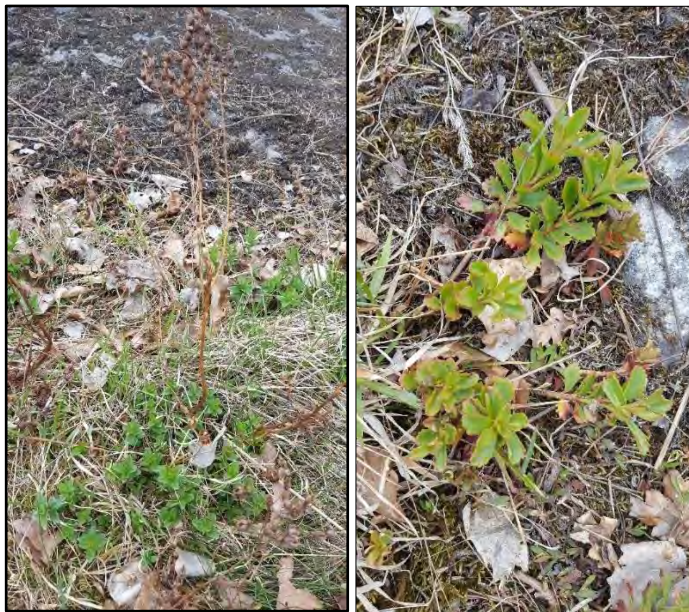
Figur 7. Johannesört och kärleksört på hållmarken i objekt 2.

Objektets naturvärden består främst av ett visst biotopvärde i form av de varma miljöer som berg i dagen och blockiga miljöer i söderläge erbjuder. Blockmarken erbjuder gömställen och övervintringsplatser för till exempel övervintrande krä- och groddjur. Äldre tallar i öppna och solbelysta miljöer är en viktig livsmiljö för kryptogamer och insekter. Objektet bedöms att ha ett obetydligt artfårde i form av de blommande örterna som ärenpris, kärleksört och johannesört som även är viktiga födokällor för pollinerande insekter. Ärenpris är en signalart för ängs- och betesmarker men signalerar i det här fallet en öppen, torr och varm miljö.