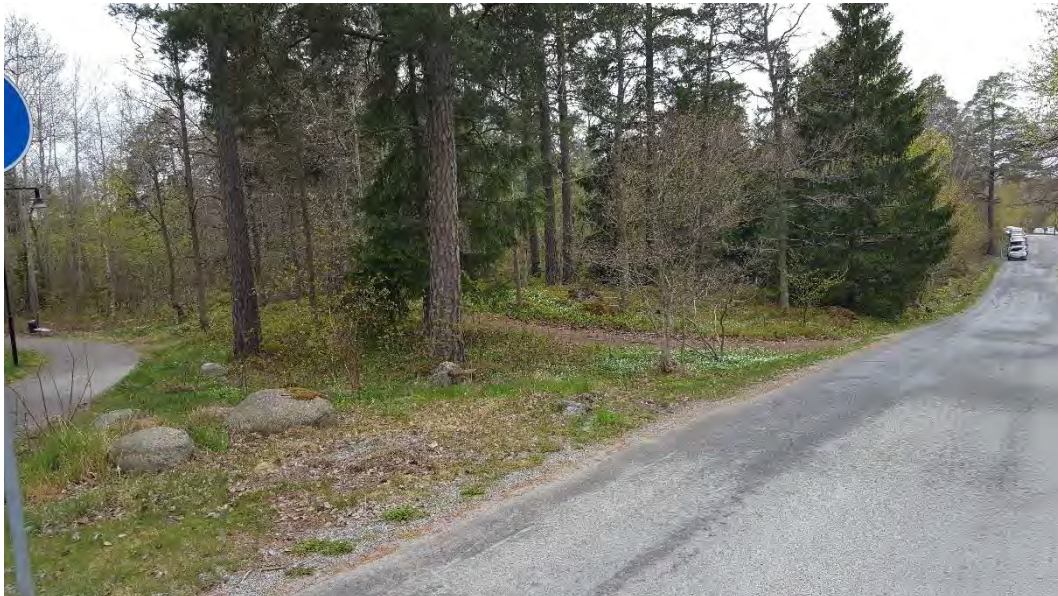
Figur 16. Bild på naturvärdesobjekt 11. Tallen till vänster i bild har tallticka (NT).

Bedömning: Naturvärdesobjektet bedöms ha ett påtagligt naturvärde som främst består av ett visst biotopvärde i form av gamla grova tallar som delvis står soligt och öppet och med fynd av tallticka. Grova äldre, både levande och döda tallar i öppna solbelysta miljöer gynnar många insekter och kryptogamer. Naturvärdesobjektet bedöms att ha ett visst artvärde i form av den rödlistade arten tallticka (NT) samt ett något artrikt träd- och buskskikt.