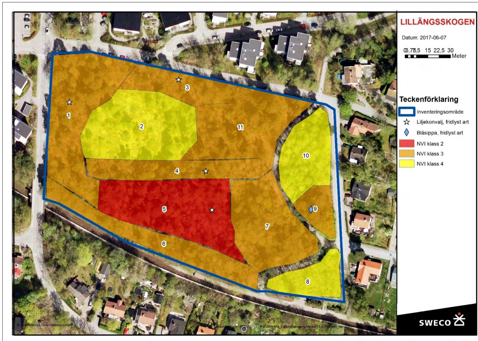
Figur 18. Karta över fynd av de fridlysta arterna blåsippa och liljekonvalj samt naturvärdesobjekt. Blåsippan är fridlyst enligt 8 och 9 §§ artskyddsförordningen och liljekonvalj enligt 9 § artskyddsförordningen. Se även bilaga 1.