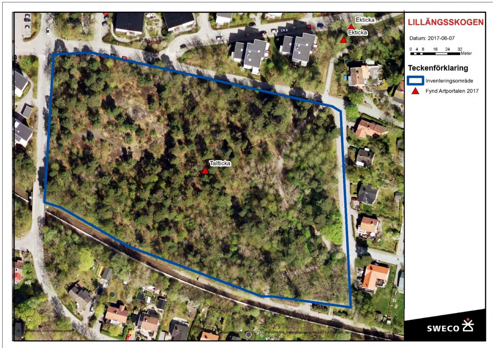
Figur 3. Karta över det aktuella inventeringsområdet Lillängsskogen och rödlistade arter registrerade i ArtPortalen 2017. Se även bilaga 1.