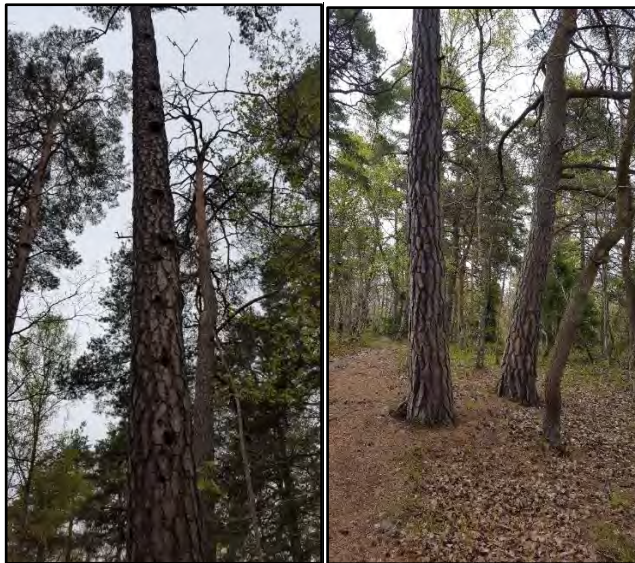
Figur 10. Grov äldre tall med tallticka (NT) och flera bohål samt äldre tallar med pansarbark i naturvärdesobjekt 5.

Objektets biotopvärde bedöms som påtagligt och består främst av gamla grova tallar som står delvis soligt och öppet och med flera fynd av tallticka och med bohål. Äldre tallar med bohål är en viktig livsmiljö för många småfåglar. Inom objektet finns fyra särskilt skyddsvärda träd. Grova äldre, både levande och döda tallar i öppna solbelysta miljöer gynnar många insekter och kryptogamer. Blommande och bärande buskar samt förekomsten av död ved bidrar till objektets biotopvärde. Naturvärdesobjektet bedöms att ha ett påtagligt artvärde som utgörs av en livskraftig förekomst av den rödlistade arten tallticka (NT).