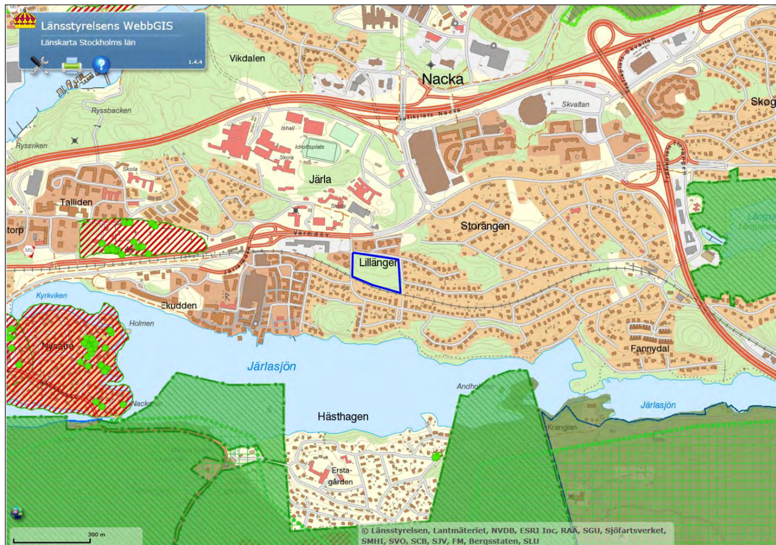
Figur 4. Urklipp ur länstyrelsens WebbGIS, länskarta Stockholms län. Kartan visar det aktuella inventeringsområdet (blå linje), Nacka reservatet på andra sidan Järlasjön, Långsjös naturreservat (grönstreckat) och områden med särskilt skyddsvärda träd (röd streckade ytor samt gröna prickar).