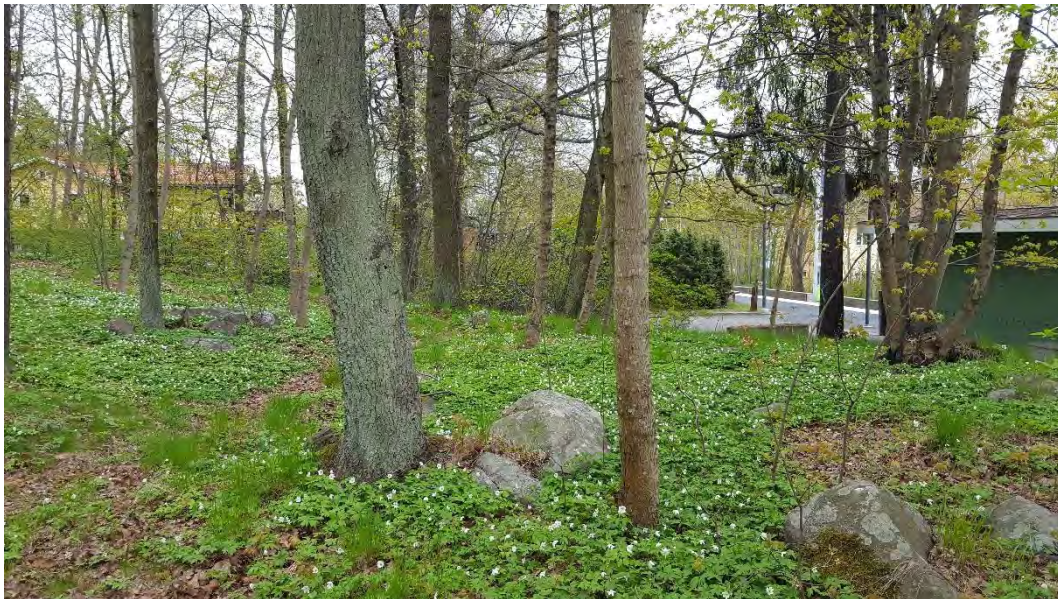
Figur 13. Öppen miljö med lövträd samt med fältskikt bestående av vitsippor i naturvärdesobjekt 8.

Naturvärdesobjektet bedöms att ha ett obetydligt artvärde.