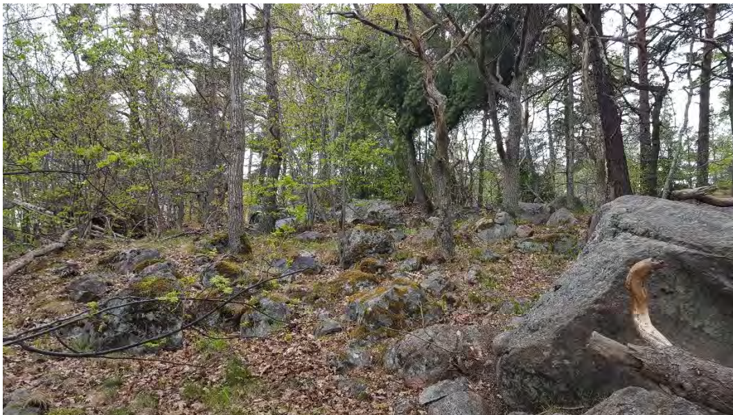
Figur 11. Blockrik miljö med senvuxna ekar och äldre tallar i naturvärdesobjekt 6.

Objektet bedöms att ha ett påtagligt biotopvärde och objektets naturvärden består främst av den blockrika miljön. Variationen som den blockrika miljön erbjuder, skapar livsmiljöer till många arter. De blommande och bärande träden är viktiga födoresurser för pollinerande insekter och fåglar. Äldre tallar och ekar, både levande och döda, är ett viktigt substrat för kryptogamer och insekter. Äldre tallar med bohål är en viktig livsmiljö för många småfåglar. Naturvärdesobjektet bedöms att ha ett visst artvärde som utgörs av ett artrikt busk- och trädskikt.