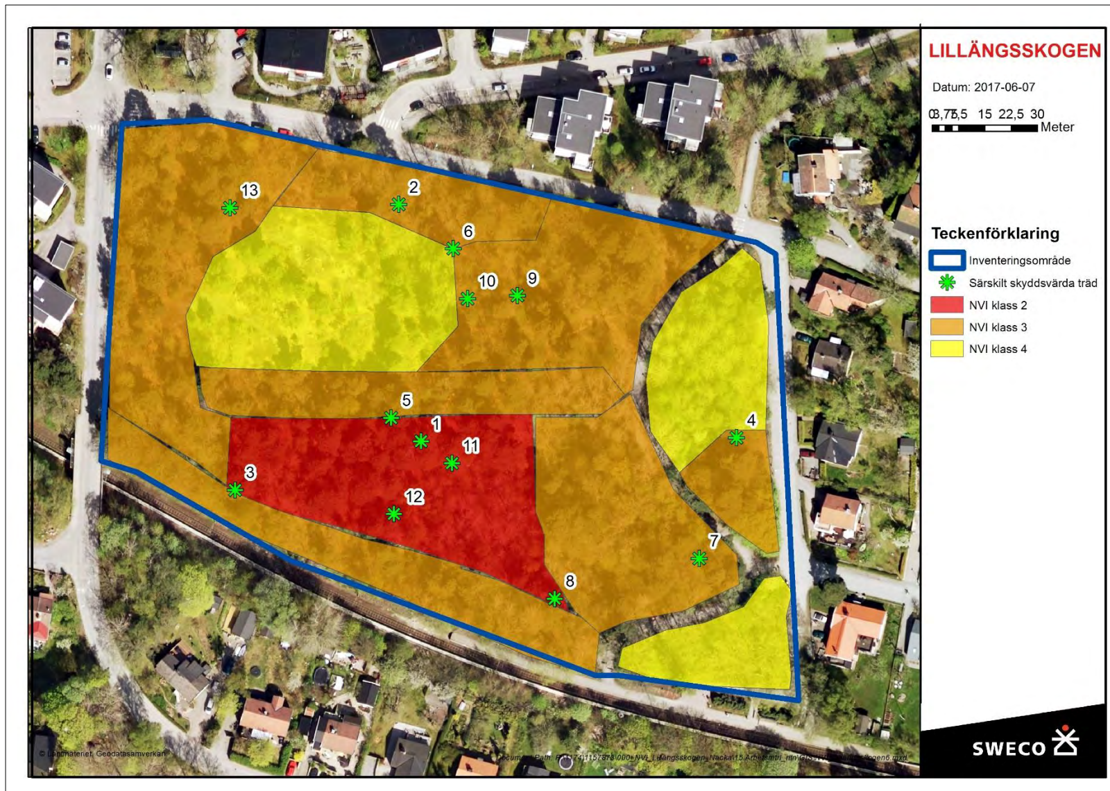
Figur 17. Karta över särskilt skyddsvärda träd registrerade vid fältbesöket den 15 maj. Se tabell 2 för beskrivning och bilaga 1 för större karta.