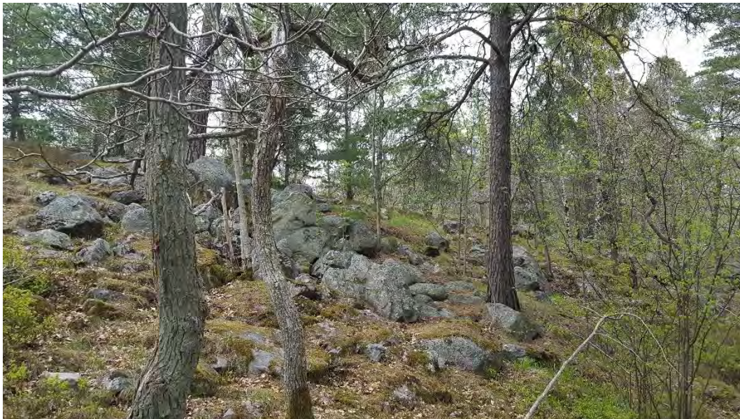
Figur 9. Blockrik miljö i sydslutning i naturvärdesobjekt 4. Senvuxna ekar och äldre tallar och också blommande småträd som rönn, lönn och hassel.

Bedömning: Naturvärdesobjektet bedöms att ha ett påtagligt naturvärde. Biotopvärde bedöms som påtagligt och består främst av den blockrika miljön skapar livsmiljöer till många arter. Blommande och bärande träd är viktiga födoresurser för pollinerande insekter och fåglar och äldre tallar är ett viktigt substrat för kryptogamer och insekter. Äldre tallar med bohål är viktiga livsmiljöer för många småfåglar. Naturvärdesobjektet bedöms att ha ett visst artvärde som utgörs av den rödlistade arten talticka (NT).