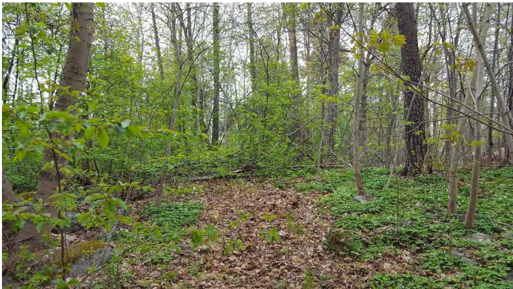
Figur 15. Blommande och bärande buskskikt i naturvärdesobjekt 10.

Objektet biotopvärde bedöms som visst och består främst av gamla grova tallar som står delvis soligt och öppet. Grova äldre, både levande och döda tallar i öppna solbelysta miljöer gynnar många insekter och kryptogamer. De blommande och bärande buskarna höjder biotopvärdet och skapar livsmiljöer och födosökmiljöer för fåglar och pollinerande insekter. Naturvärdesobjektet bedöms att ha ett visst artvärde i form av ett artrikt busk- och trädskikt.