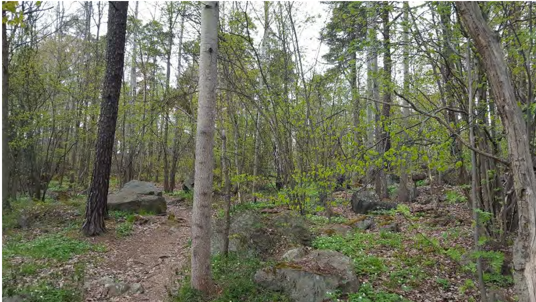
Figur 12. Lundartad miljö med ek hassel och äldre grova tallar i naturvärdesobjekt 7.

Bedömning: Naturvärdesobjektet bedöms att ha ett påtagligt naturvärde. Objektets bedöms att ha ett påtagligt biotopvärde som består främst av förekomst av död ved, olika lövträden men också de äldre tallarna som är viktiga substrat och livsmiljöer för kryptogamer och insekter samt de blommande och bärande träden gynnar många insekter och fåglar vid födosök. Ekarna utgör en viktig livsmiljö för många arter. Naturvärdesobjektet bedöms att ha ett visst artvärde som utgörs av ett artrikt busk- och trädskikt.