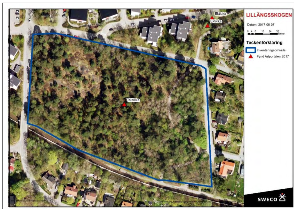
Figur 3. Karta över det aktuella inventeringsområdet Lillängsskogen och rödlistade arter registrerade i ArtPortalen 2017. Se även bilaga 1.

Tallticka är en signalart (Nitare 2000) och växer vanligast på träd som är 150 - 200 år eller äldre. Svampen växer på levande träd och dör själv efter några år när trädet dör. Därför är det viktigt med efterföljare, alltså en jämn förnygring av tall för att arten ska överleva på sikt i ett område. Arten växer i skogstyper där det finns inslag av gamla tallar. Arten signalerar skyddsvärda tallbestånd med höga naturvärden. Den är främst knuten till tallnatureskogar och restbiotoper med gamla träd vilka ofta utgör livsmiljö för många ovanliga och rödlistade arter som till exempel flera olika insektsarter (Nitare 2000). Tallticka bedöms ha minskat generellt på grund av skogsavverkningar av gammal tallskog samt kapning av gamla trädolitärer i trädgårdar och stadsmiljöer (ArtDatabanken 2017).