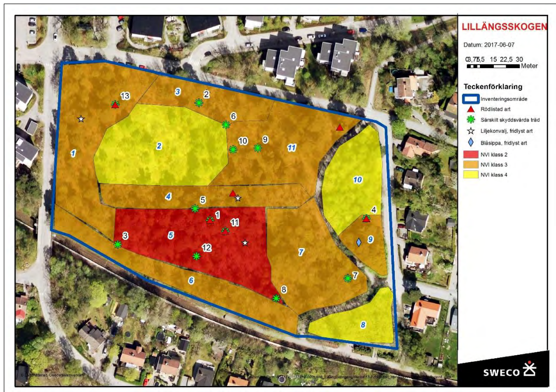
Figur 5. Karta över det inventerade områdets naturvärdesobjekt (blå numrering 1-11) och fynd av den rödlistade tallticken. De särskilt skyddsvärda träden (svart numrering 1-13) klassas med klass 2 enligt standarden. Se även bilaga 1.

Vid bedömning av artvärde inom objekten har objekt med endast enstaka fynd av tallticka bedömts att ha ett visst artvärde. För att ett område ska uppnå påtagligt artvärde ska den rödlistade arten ha en livskraftig förekomst inom objektet det vill säga fler än ett fynd bör noteras inom objektet. Inom inventeringsområdet som helhet bedöms dock tallticken att ha en livskraftig förekomst.