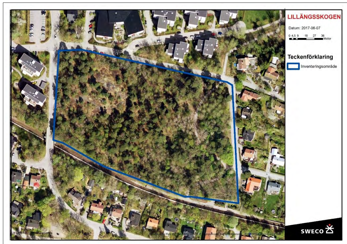
Figur 1. Karta över inventeringsområdet Lillängsskogen i Nacka kommun. Se även bilaga 1.

Inventeringsområdet rör Lillängsskogen i Nacka kommun (Figur 1).